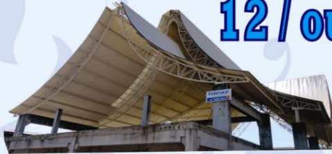
EM PROL DA CONSTRUÇÃO DA NOVA IGREJA MATRIZ

Com a Mãe Aparecida Seguimos Jesus. Nossa Luz!