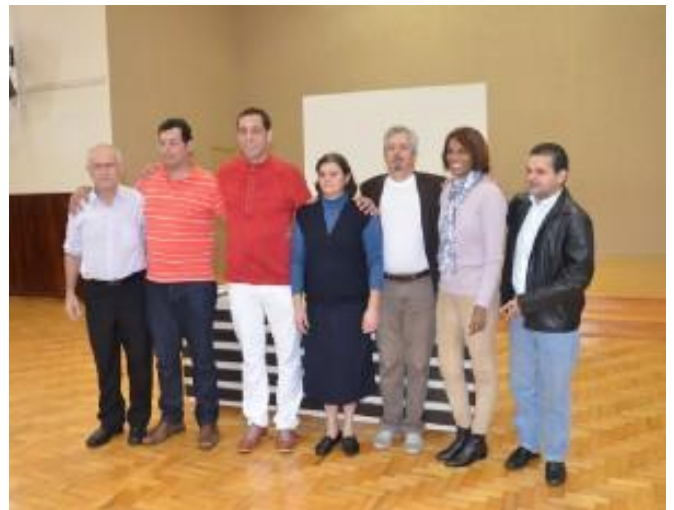
A nova coordenação estadual eleita na Assembleia.