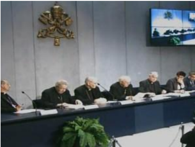
Coletiva de imprensa que apresentou documento de trabalho do próximo sínodo, sobre família

No dia 26 de junho foi divulgado o texto preparatório - o chamado "Instrumento de trabalho" - do Sínodo extraordinário de outubro próximo que terá como tema "Os desafios pastorais da família, no contexto da evangelização". Numa conferência de imprensa, ao meio-dia, foi apresentado este texto, divulgado nas seis línguas oficiais do Sínodo: alemão, espanhol, francês, inglês, italiano e português.