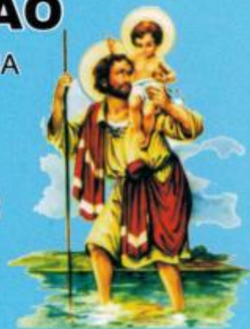
PADROEIRO DOS MOTORISTAS