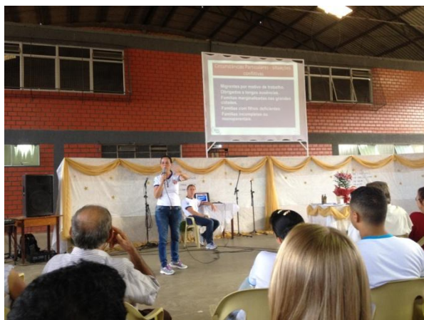
Casal coordenador diocesano apresenta os casos especiais (conflitivos e irregulares)

matrimônio a experiência, uniões livres de fato, católicos unidos apenas em casamento civil, separados e divorciados sem segunda união e os casais em 2ª união. Foi apresentado também o trabalho do grupo Bom Pastor que visa o acolhimento dos casais em 2ª união através de retiro para casais visando em seguida a inserção destas pessoas nos trabalhos da igreja.