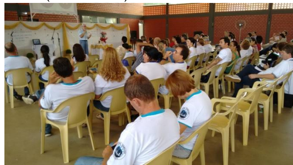
Dc. Juares apresenta o tema sobre a homossexualidade

pessoas são chamadas a realizar a vontade de Deus em sua vida e, se forem cristãs, a unir ao sacrifício da cruz do Senhor as dificuldades que podem encontrar por causa de sua condição (CIC n. 2358). As pessoas homossexuais são chamadas à castidade. Pelas virtudes de autodomínio, educadoras da liberdade interior, às vezes pelo apoio duma amizade desinteressada, pela oração e pela graça sacramental, podem e devem se aproximar, gradual e resolutamente, da perfeição cristã (CIC n. 2359).”