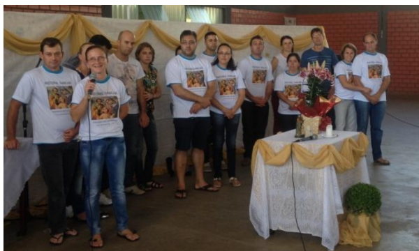
Equipe da PF da paróquia São João Batista acolheu os demais casais

Foi realizado no dia 22 de fevereiro na paróquia São João Batista em Contenda o 3º encontro de formação do Setor Pastoral I que abordou o tema do Setor de Casos Especiais da Pastoral Familiar. Todas as paróquias do setor enviaram agentes de pastoral totalizando 53 casais (106 pessoas).