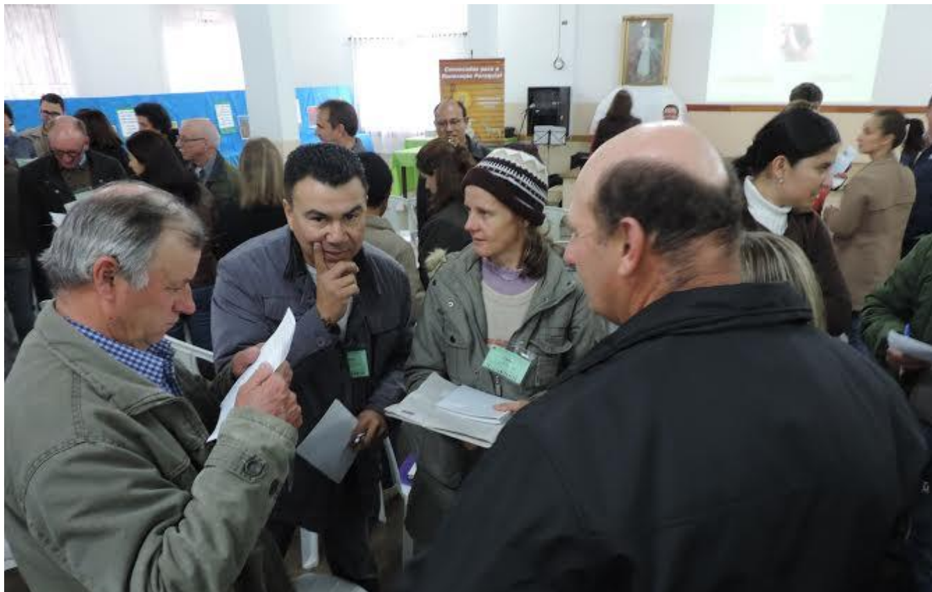
Celebração de Abertura: Em pequenos grupos os participantes escreveram e refletiram sobre suas conquistas e desafios em relação aos Conselhos.

22 a 28 de junho de 2015 – Ano 2015 – n.º 82 www.diocesesp.org.br / aed@diocesesp.org.br