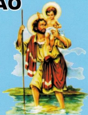
PADROEIRO DOS MOTORISTAS