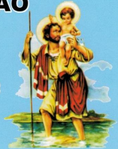
PADROEIRO DOS MOTORISTAS