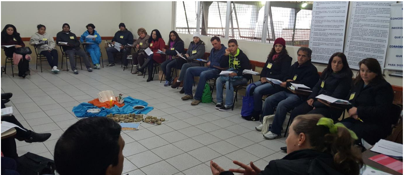
Grupo de estudo: Momento celebrativo nos grupos.

06 a 26 de julho de 2015 – Ano 2015 – n.º 84 www.diocesesp.org.br / aed@diocesesp.org.br