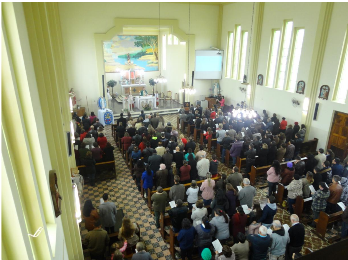
Pela manhã os formadores participaram da Celebração Eucarística com a comunidade Matriz.