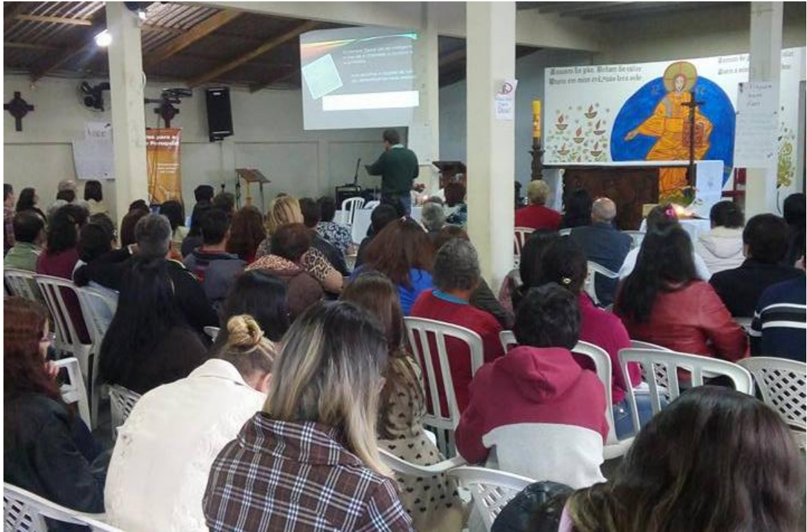
02 de agosto – Paróquia Nossa Senhora Aparecida – Guatupê.