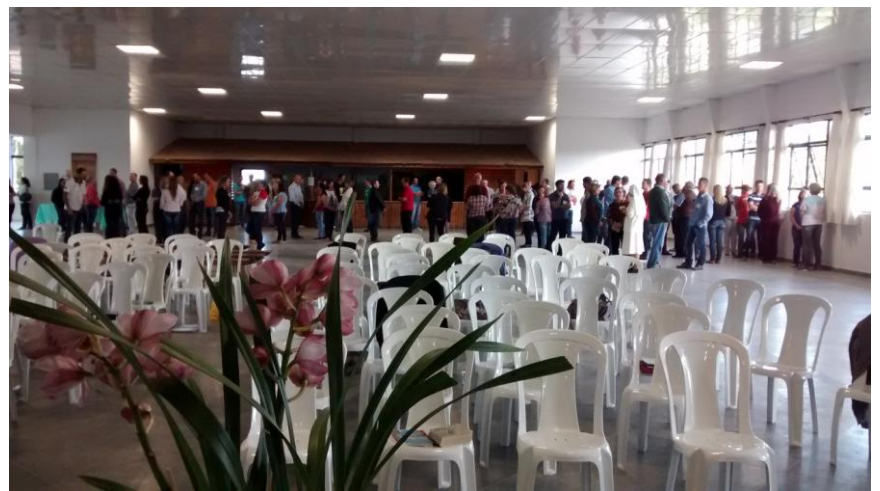
Paróquia Sagrado Coração de Jesus - Murici