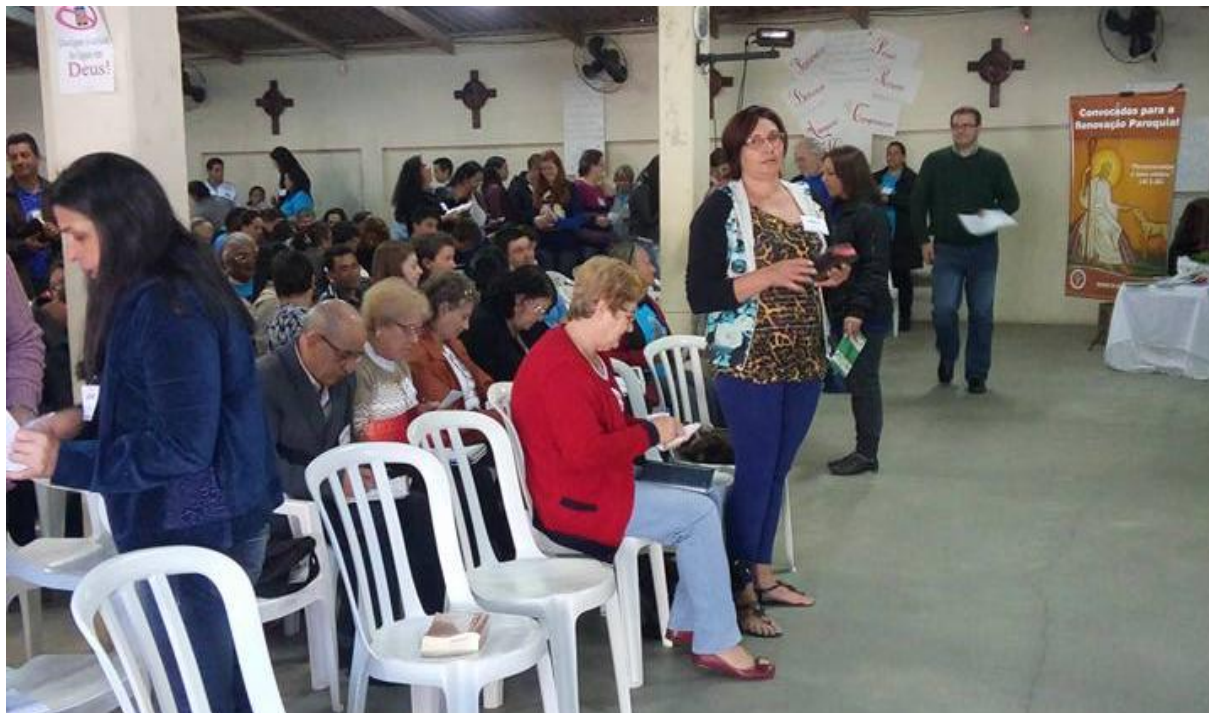
Paróquia Nossa Senhora Aparecida – Guatupê

10 a 16 de agosto de 2015 – Ano 2015 – n.º 87 www.diocesesjp.org.br / aed@diocesesjp.org.br