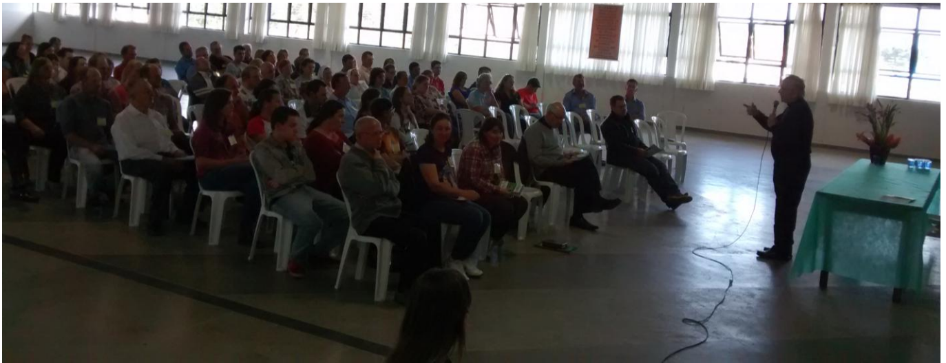
Paróquia Sagrado Coração de Jesus - Murici

10 a 16 de agosto de 2015 – Ano 2015 – n.º 87 www.diocesesp.org.br / aed@diocesesp.org.br