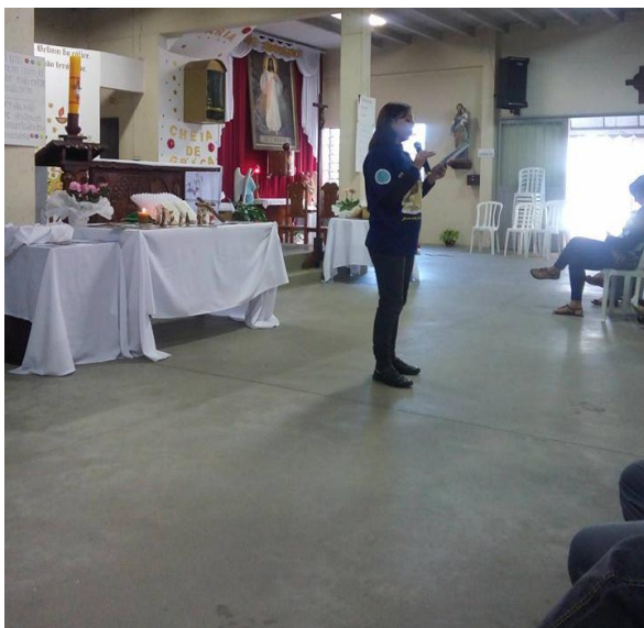
Paróquia Nossa Senhora Aparecida – Guatupê.

Foi muito bom reunirmos para esta segunda etapa, agora tudo vai ficando mais claro e fácil para trabalhar. É importante os esclarecimentos, às vezes nos limitamos a fazer somente o que achamos certo, sem nos preocupar com o próximo.