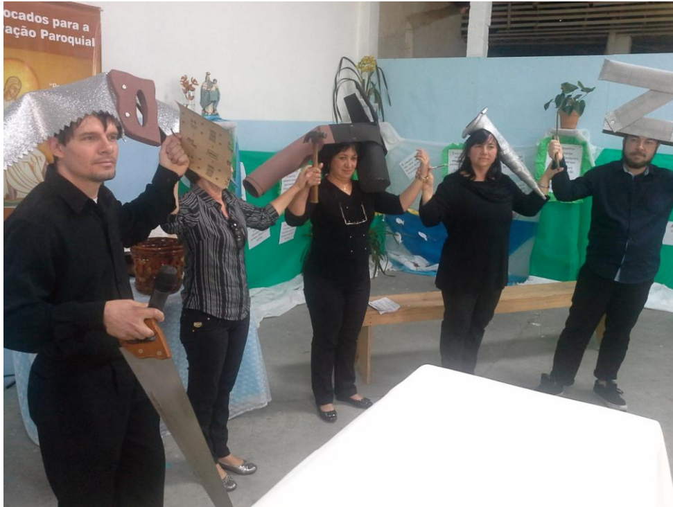
Paróquia Nossa Senhora dos Remédios – Araucária

10 a 16 de agosto de 2015 – Ano 2015 – n.º 87 www.diocesespj.org.br / aed@diocesespj.org.br