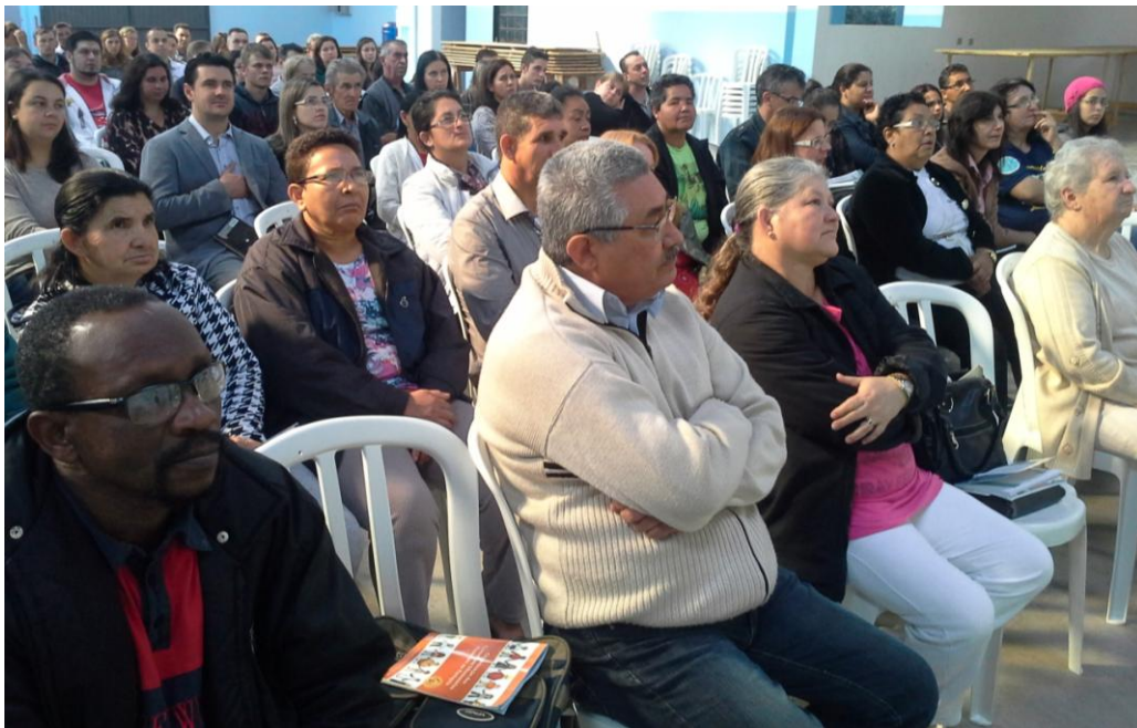
Paróquia Nossa Senhora dos Remédios – Araucária