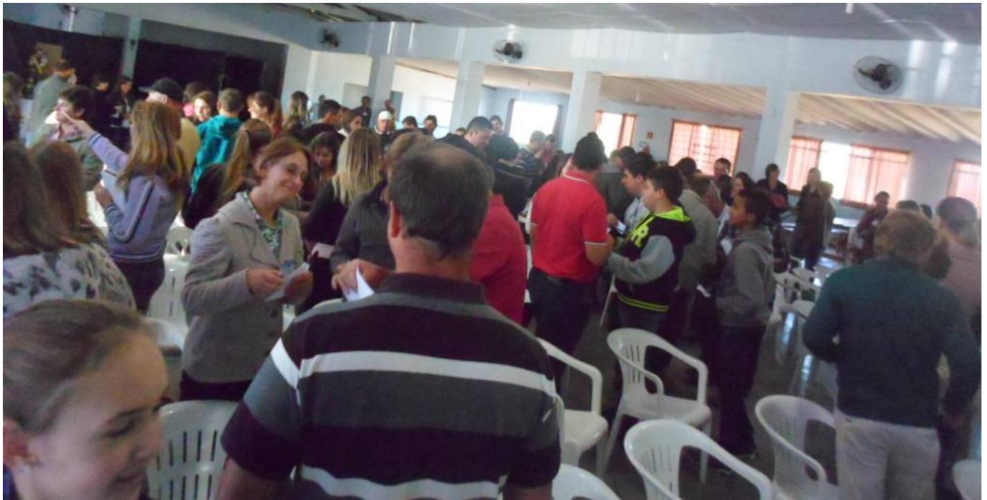
Paróquia Imaculada Conceição de Catanduvas do Sul.

07 a 13 de setembro de 2015 – Ano 2015 – n.º 91 www.diocesesp.org.br / aed@diocesesp.org.br