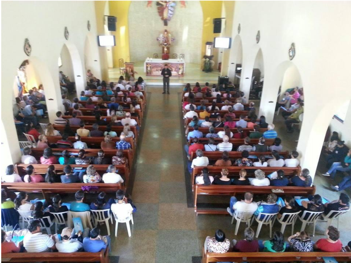
Paróquia Nossa Senhora das Dores em Tijucas do Sul.

07 a 13 de setembro de 2015 – Ano 2015 – n.º 91 www.diocesesp.org.br / aed@diocesesp.org.br