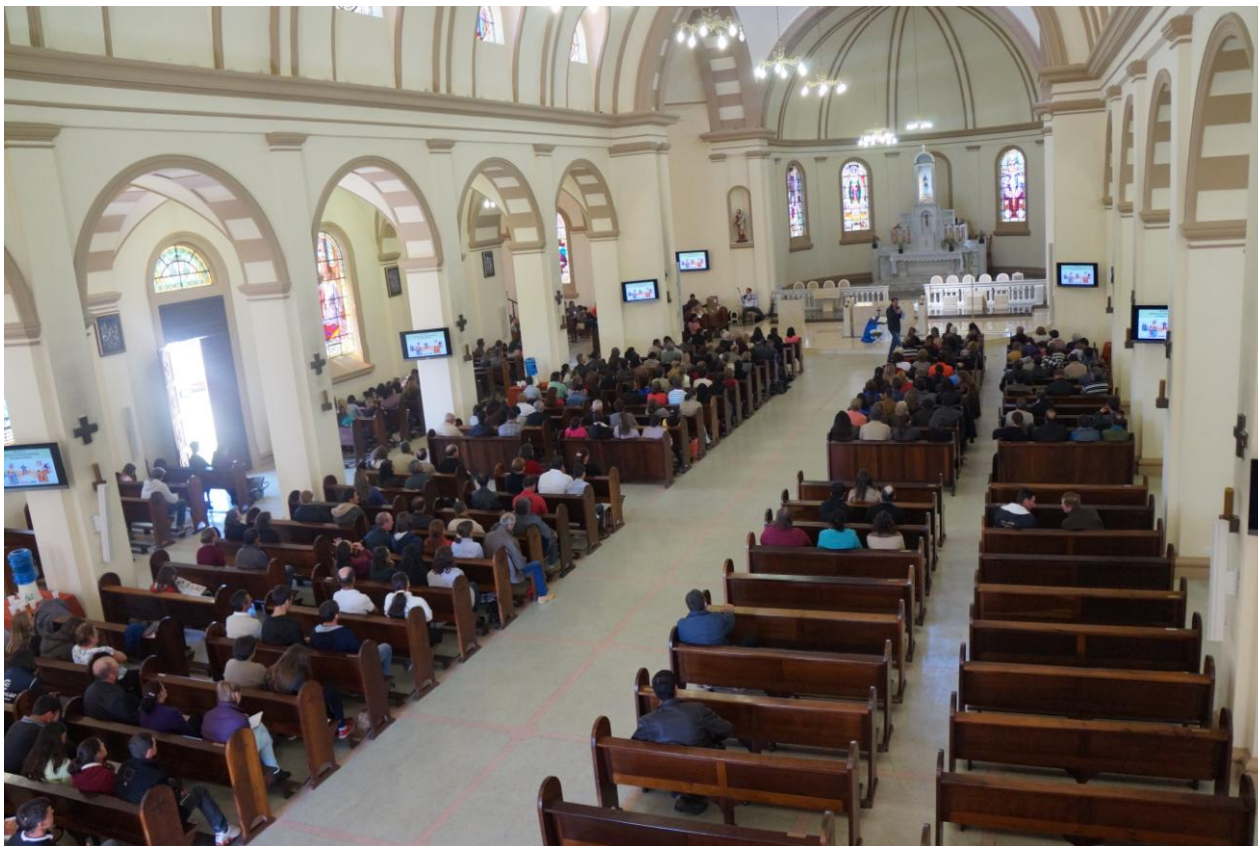
Paróquia Santo Antônio da Lapa.

07 a 13 de setembro de 2015 – Ano 2015 – n.º 91 www.diocesesp.org.br / aed@diocesesp.org.br