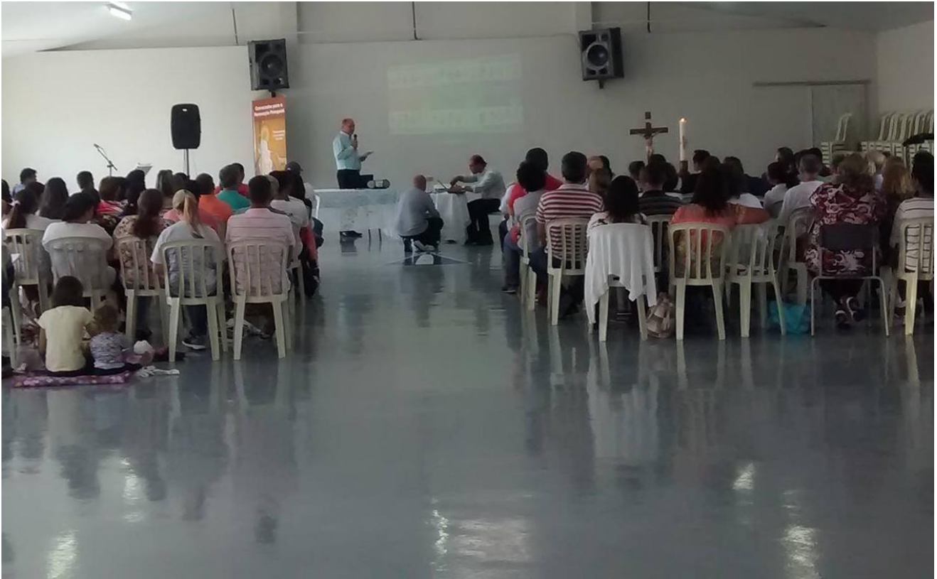
Paróquia Nossa Senhora Aparecida - Xingú - São José dos Pinhais.

07 a 13 de setembro de 2015 – Ano 2015 – n.º 91 www.diocesesp.org.br / aed@diocesesp.org.br