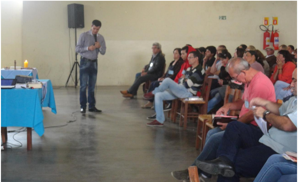
04 de Outubro. Escola Teológica Dei Verbum em Quitandinha.