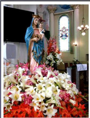
Nossa Senhora dos Remédios Titular do Santuário e Padroeira do Município de Araucária.

05 a 11 de outubro de 2015 – Ano 2015 – n.º 95 www.diocesesp.org.br / aed@diocesesp.org.br