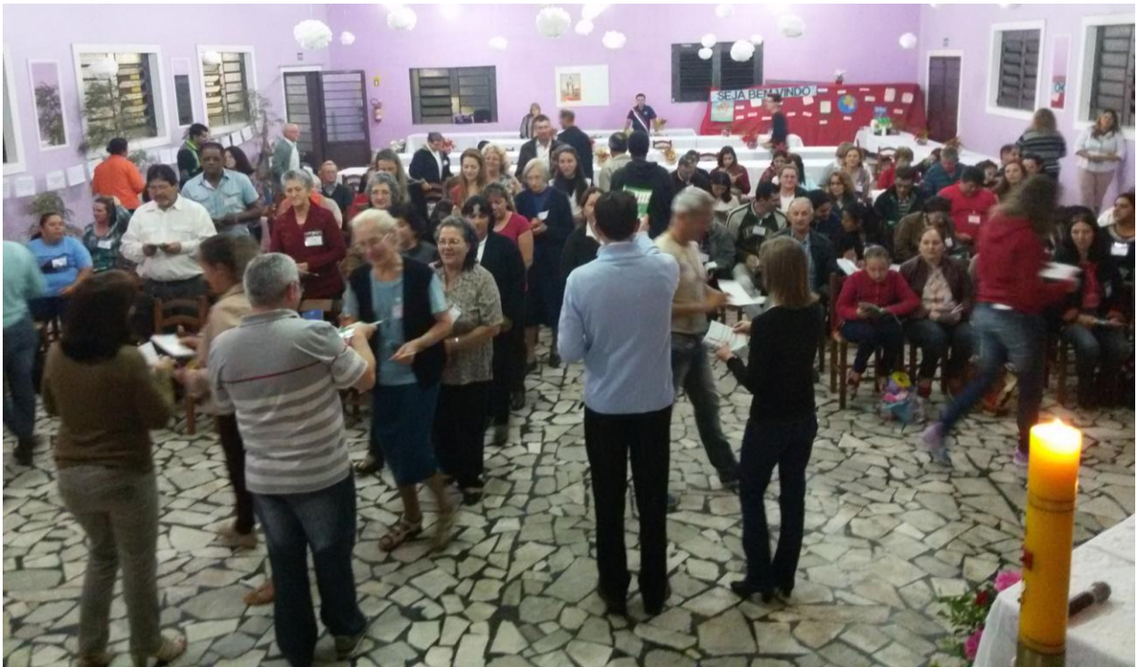
Paróquia Cristo Rei de Campo do Tenente.

05 a 11 de outubro de 2015 – Ano 2015 – n.º 95 www.diocesesp.org.br / aed@diocesesp.org.br