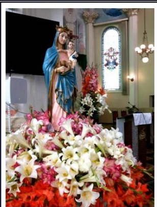
Nossa Senhora dos Remédios Titular do Santuário e Padroeira do Município de Araucária.