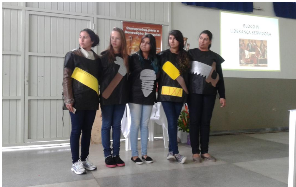
Paróquia Nossa Senhora da Luz, em Fazenda Rio Grande.

26 de outubro a 08 de novembro de 2015 – Ano 2015 – n.º 98 www.diocesesp.org.br / aed@diocesesp.org.br