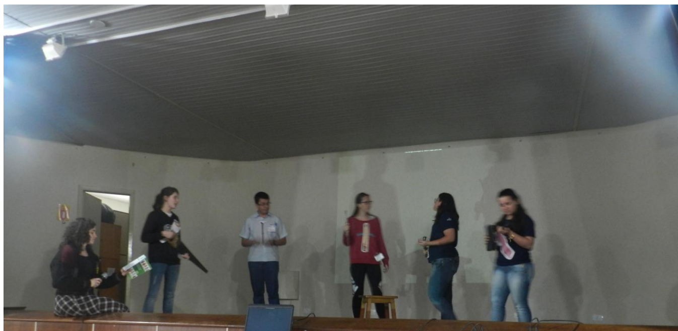
Paróquia São Pedro - São José dos Pinhais.