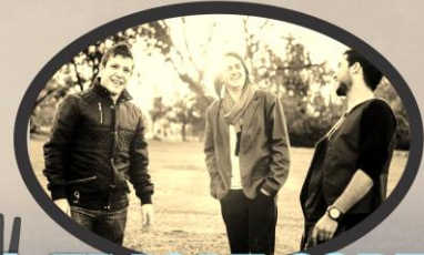
+ SINGLE CORE