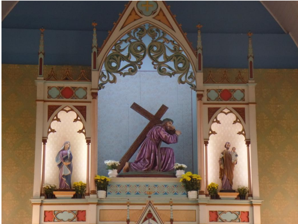
Igreja Matriz Senhor Bom Jesus dos Passos - Piraquara.

26 de outubro a 08 de novembro de 2015 – Ano 2015 – n.º 98 www.diocesesjp.org.br / aed@diocesesjp.org.br