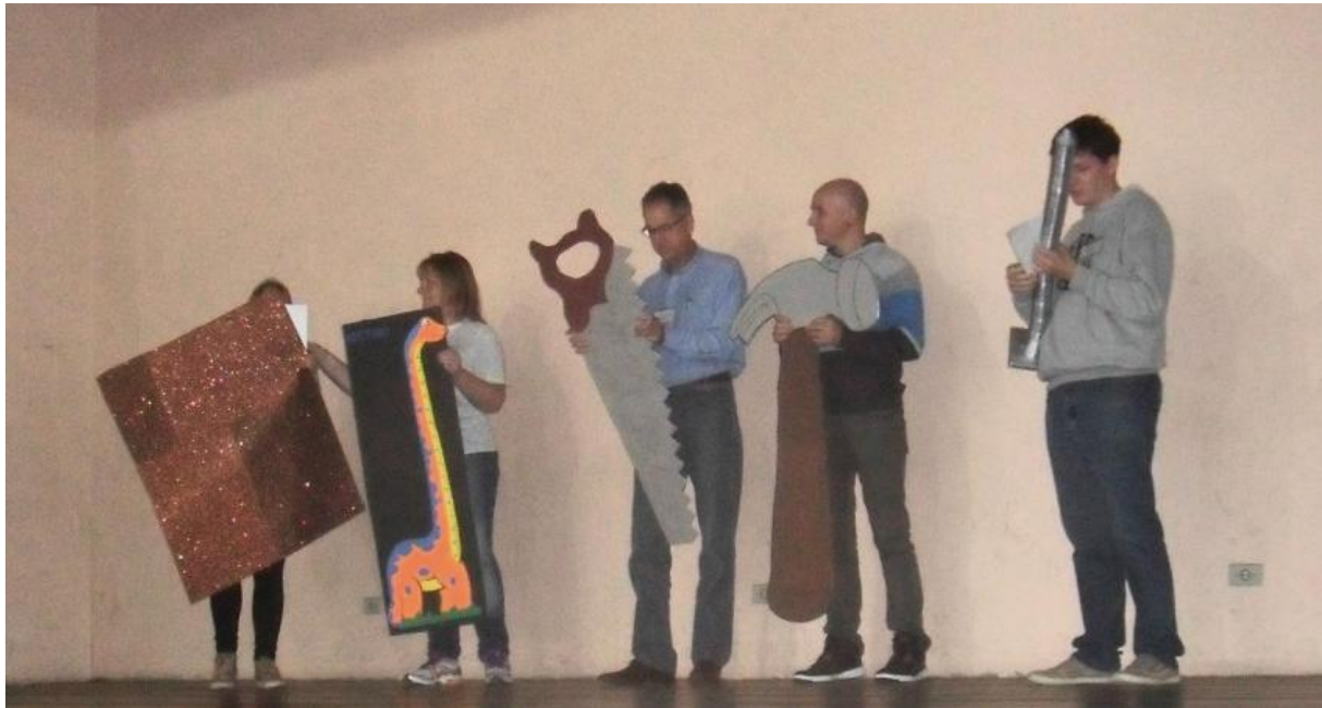
Paróquia Catedral São José.

26 de outubro a 08 de novembro de 2015 – Ano 2015 – n.º 98 www.diocesespj.org.br / aed@diocesespj.org.br