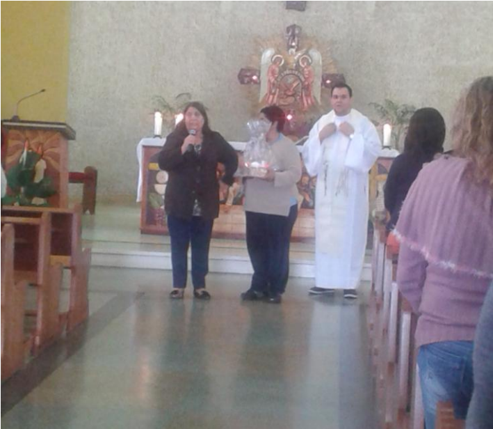
24 de outubro - Missa durante a Formação para os catequistas da Paróquia Nossa Senhora das Dores - Tijucas do Sul.

26 de outubro a 08 de novembro de 2015 – Ano 2015 – n.º 98 www.diocesespj.org.br / aed@diocesespj.org.br