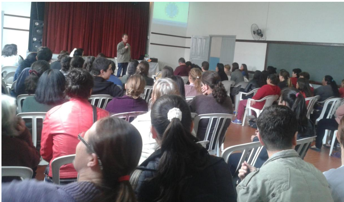
24 de outubro - Formação para os catequistas da Paróquia Nossa Senhora das Dores - Tijucas do Sul.

26 de outubro a 08 de novembro de 2015 – Ano 2015 – n.º 98 www.diocesespj.org.br / aed@diocesespj.org.br