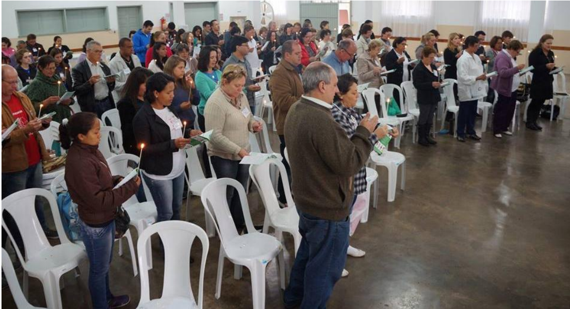
Paróquia Senhor Bom Jesus de São José dos Pinhais.

Foi um encontro abençoado para todos os participantes dessa formação, pois, aprendemos o quanto é importante à missão do discípulo missionário na comunidade, e como o Amor deve estar sempre presente em tudo aquilo que realizamos, especialmente em benefício dos mais pobres e necessitados, pois Eles são os prediletos do Pai.