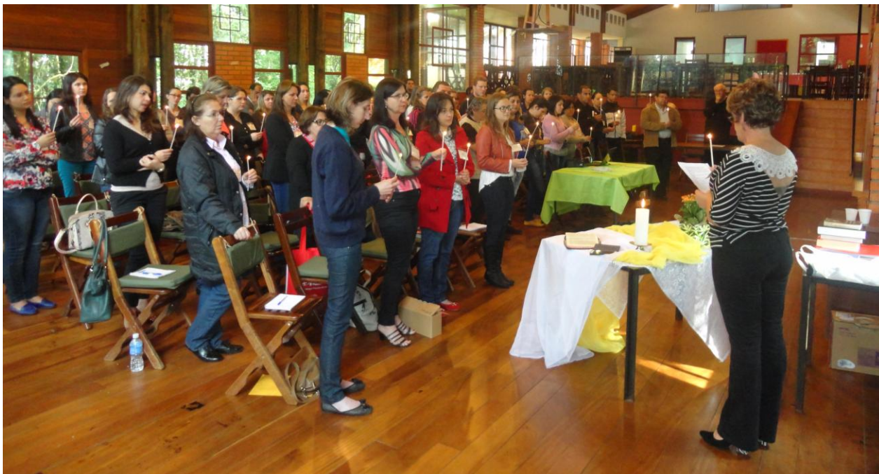
20 de outubro. Quarto encontro para secretárias(os) paroquiais.

26 de outubro a 08 de novembro de 2015 – Ano 2015 – n.º 98 www.diocesespj.org.br / aed@diocesespj.org.br