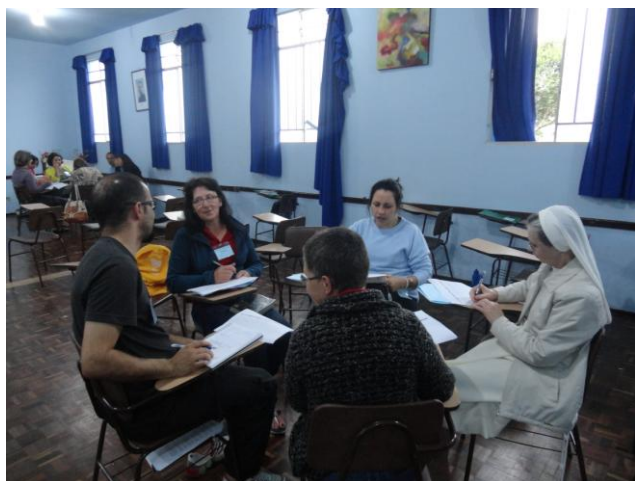
17 de outubro (tarde). Oficinas sobre Planejamento Catequético.