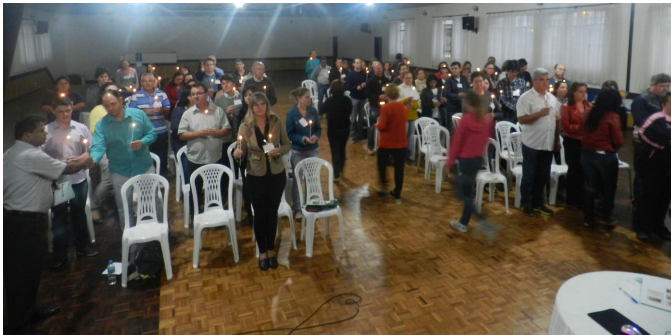
Paróquia São Pedro - São José dos Pinhais.

26 de outubro a 08 de novembro de 2015 – Ano 2015 – n.º 98 www.diocesespj.org.br / aed@diocesespj.org.br