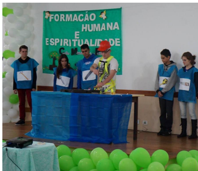
Paróquia Senhor Bom Jesus de São José dos Pinhais.