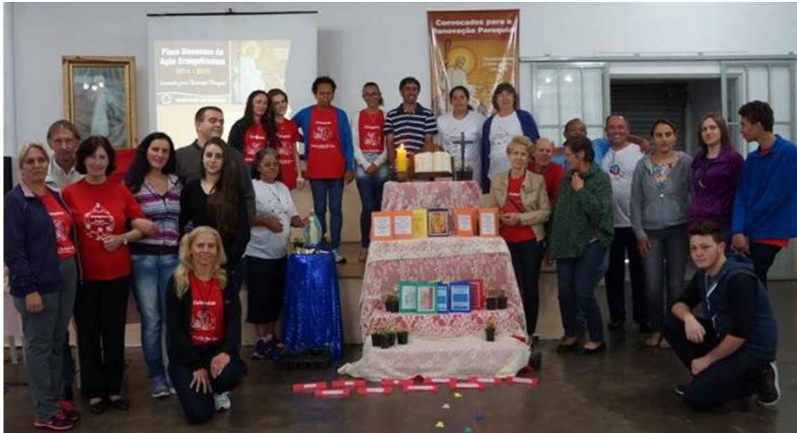
03 de outubro - Paróquia Senhor Bom Jesus - São José dos Pinhais.