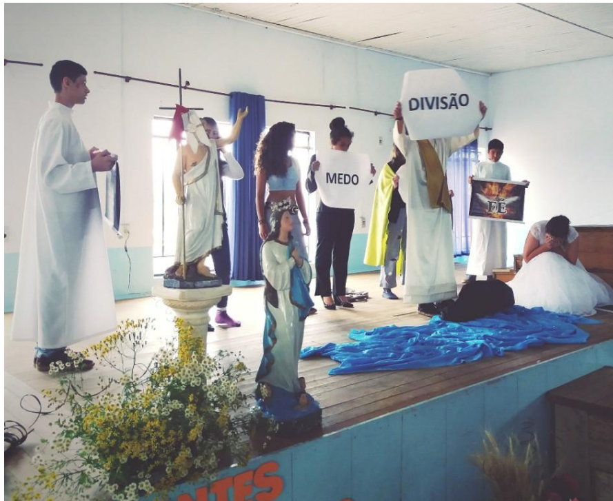
24 de outubro - Encontro dos catequistas do Setor Pastoral I.

26 de outubro a 08 de novembro de 2015 – Ano 2015 – n.º 98 www.diocesespj.org.br / aed@diocesespj.org.br