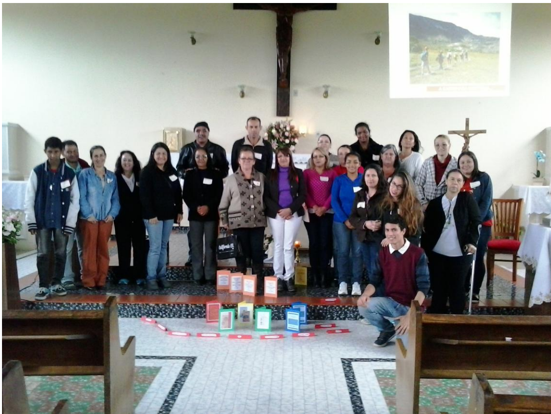
25 de outubro - Formação para os catequistas da Paróquia Nossa Senhora de Fátima - São José dos Pinhais.