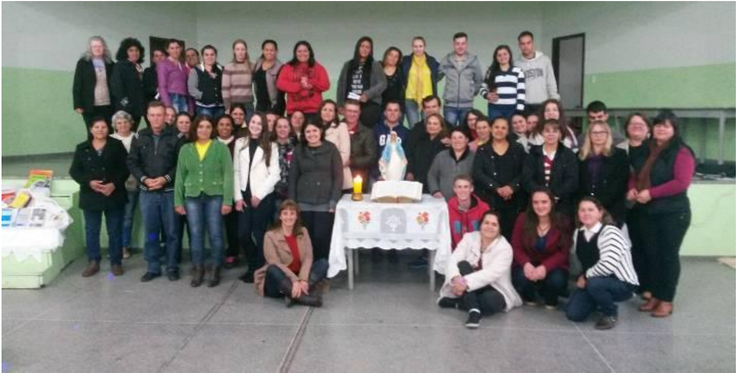
Catequistas da Paróquia Senhor Bom Jesus de Mandirituba.

22 a 28 de maio de 2017 – Ano 2017 – n.º 153 www.diocesesjp.org.br / aed@diocesesjp.org.br