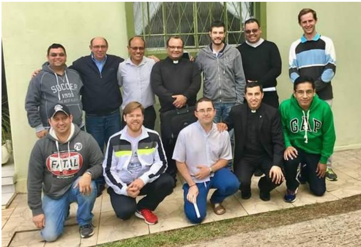
16 de maio na Paróquia Nossa Senhora Aparecida em Rio Negro.