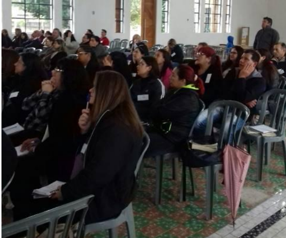
No dia 20 de maio foi realizada a formação diocesana para os catequistas da Paróquia Nossa Senhora de Fátima em São José dos Pinhais.