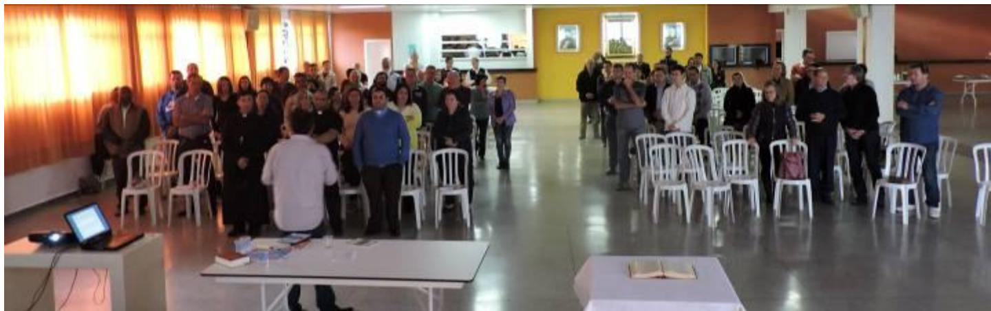
Setor Pastoral III

03 a 30 de julho de 2017 – Ano 2017 – n.º 158 www.diocesesp.org.br / aed@diocesesp.org.br