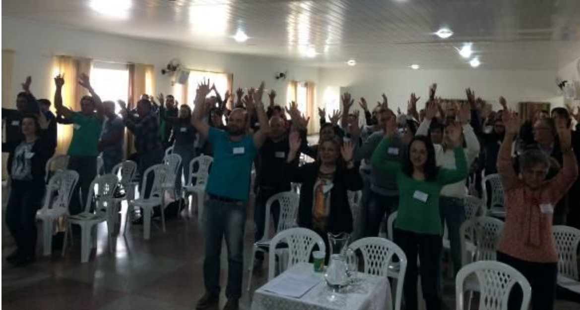
Setor Pastoral I

03 a 30 de julho de 2017 – Ano 2017 – n.º 158 www.diocesesp.org.br / aed@diocesesp.org.br