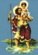
Padroeiros dos Milhões

BAIRRO SÃO CRISTÓVÃO SÃO JOSÉ DOS PINHÃES - PR RUA APARECIDA, 291