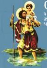
Padroeiro dos Motoristas

BAIRRO SÃO CRISTÓVÃO SÃO JOSÉ DOS PINHAIS - PR RUA ARAPONGAS, 1220