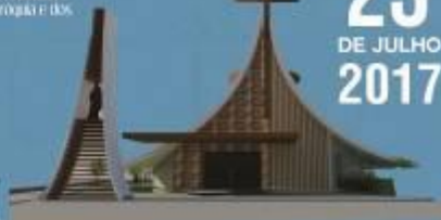
Padroado de Milhões de Milhões