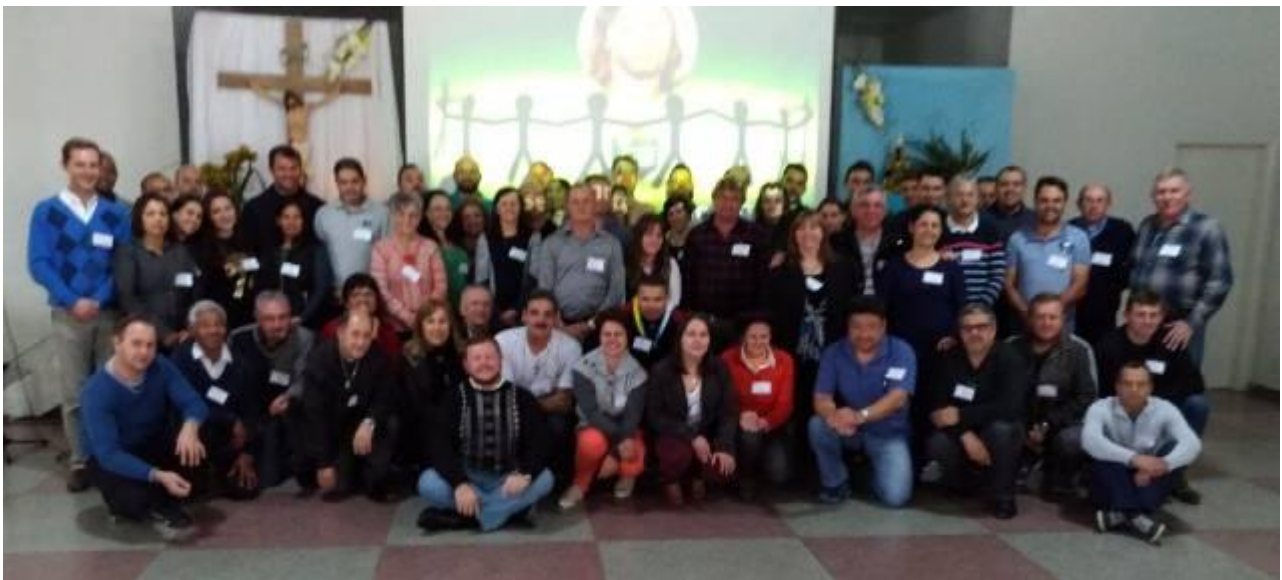
Setor Pastoral I