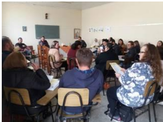
Grupos de estudos - Formadores de Catequistas.