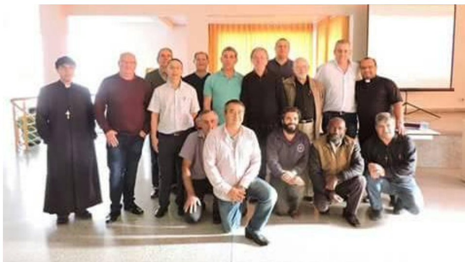
Padres e Diáconos do Setor Pastoral III presente no encontro.