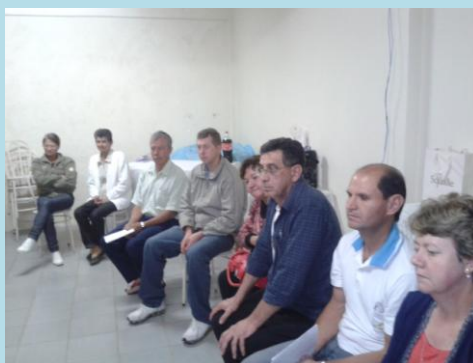
Reunião na Paróquia Nossa Senhora de Fátima - Fazenda Rio Grande 26/11