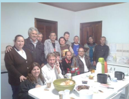
Reunião em Mandirituba na Paróquia Senhor Bom Jesus 17/10