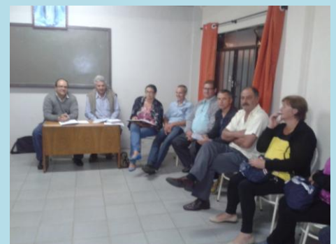
Reunião na Paróquia Nossa Senhora de Fátima - Fazenda Rio Grande 26/11