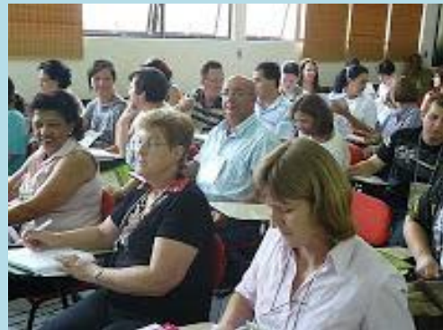
Catequistas das dioceses do Paraná - turma de 2011-2012

Durante os quatro dias em cada etapa os representantes das dioceses do Paraná estarão aprofundando os conhecimentos em quatro eixos formativos: Bíblico, Metodológico, Litúrgico e Teológico. Além das palestras ocorrem também as oficinas de construção conhecimento, prática da Leitura Orante da Bíblia, Celebrações Eucarísticas e momentos de convivência.