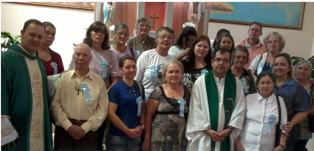
Mensageiras da Paróquia Santos Reis - Lapa.