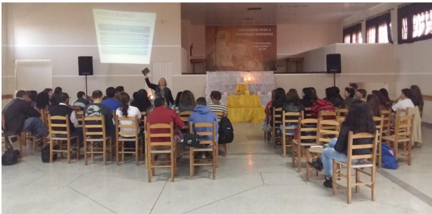
03 de maio - Catequistas da Paróquia São Gabriel da Virgem Dolorosa em Fazenda Rio Grande.

11 a 17 de maio de 2015 – Ano 2015 – n.º 76 www.diocesesp.org.br / aed@diocesesp.org.br