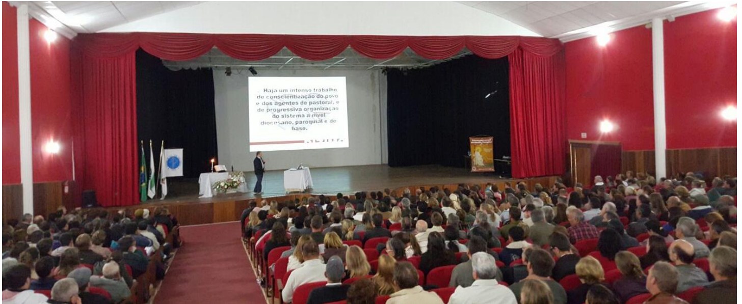
563 agentes participaram da formação.

14 a 20 de setembro de 2015 – Ano 2015 – n.º 92 www.diocesespj.org.br / aed@diocesespj.org.br