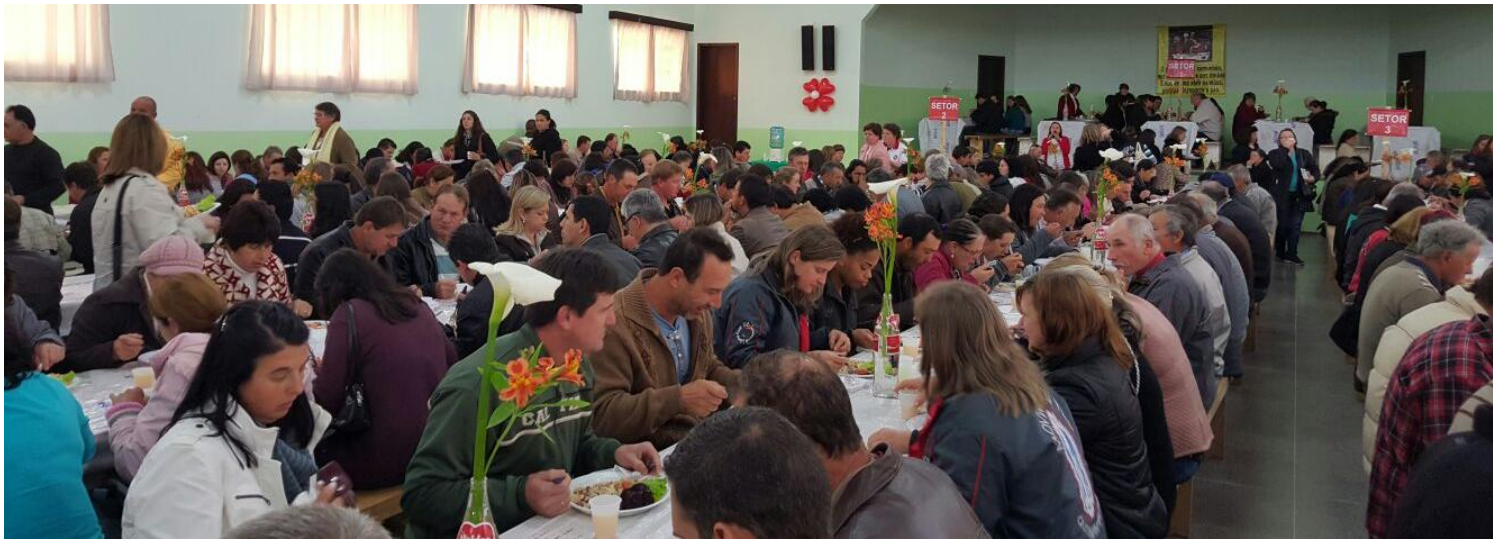
Almoço preparado pelas lideranças da Paróquia Senhor Bom Jesus - Mandirituba.

14 a 20 de setembro de 2015 – Ano 2015 – n.º 92 www.diocesesp.org.br / aed@diocesesp.org.br