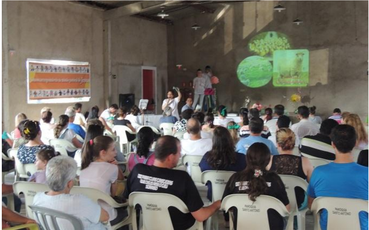
Paróquia Santo Antonio - São José dos Pinhais

28 de setembro a 04 de outubro de 2015 – Ano 2015 – n.º 94 www.diocesespj.org.br / aed@diocesespj.org.br