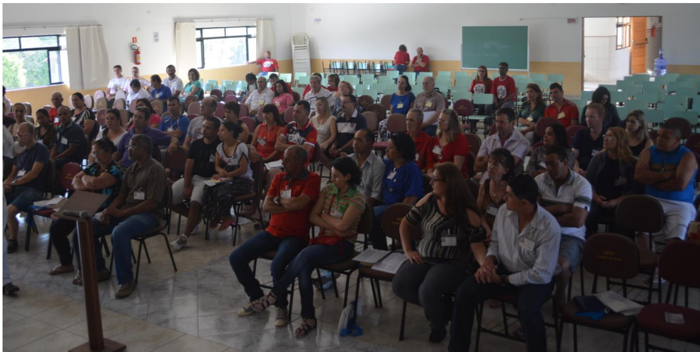
11º retiro diocesano para casais que vivem em 2ª união promovido pela Comissão Diocesana de Pastoral Familiar.

28 de setembro a 04 de outubro de 2015 – Ano 2015 – n.º 94 www.diocesesp.org.br / aed@diocesesp.org.br