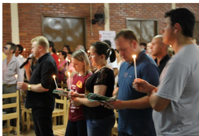
Paróquia Nossa Senhora das Graças - Piên.