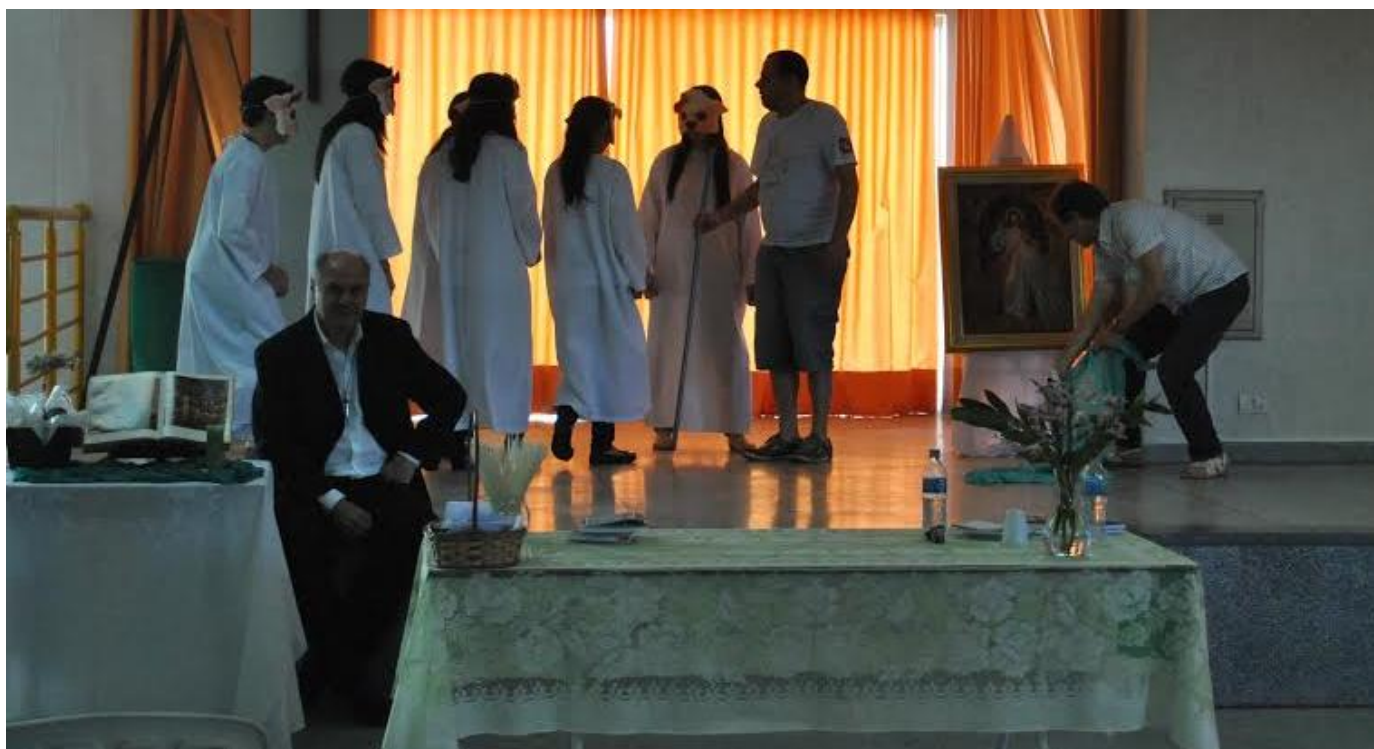
Paróquia Nossa Senhora do Monte Claro.

28 de setembro a 04 de outubro de 2015 – Ano 2015 – n.º 94 www.diocesesp.org.br / aed@diocesesp.org.br