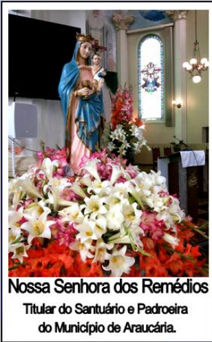
Nossa Senhora dos Remédios Titular do Santuário e Padroeira do Município de Araucária.

12 a 18 de outubro de 2015 – Ano 2015 – n.º 96 www.diocesesp.org.br / aed@diocesesp.org.br