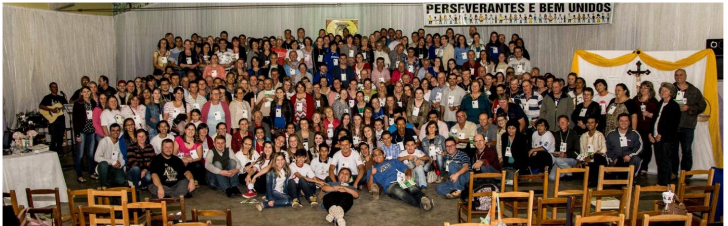
Paróquia Nossa Senhora do Perpétuo Socorro - Araucária.

12 a 18 de outubro de 2015 – Ano 2015 – n.º 96 www.diocesesp.org.br / aed@diocesesp.org.br