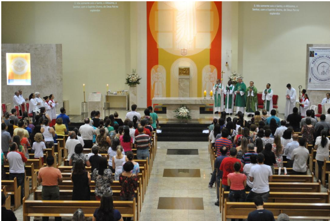
Missa do Nascituro na Igreja Matriz Nossa Senhora do Monte Claro, celebrada por Dom Francisco Carlos Bach.

12 a 18 de outubro de 2015 – Ano 2015 – n.º 96 www.diocesespj.org.br / aed@diocesespj.org.br