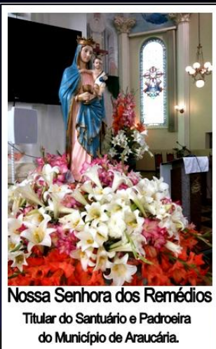
Nossa Senhora dos Remédios Titular do Santuário e Padroeira do Município de Araucária.