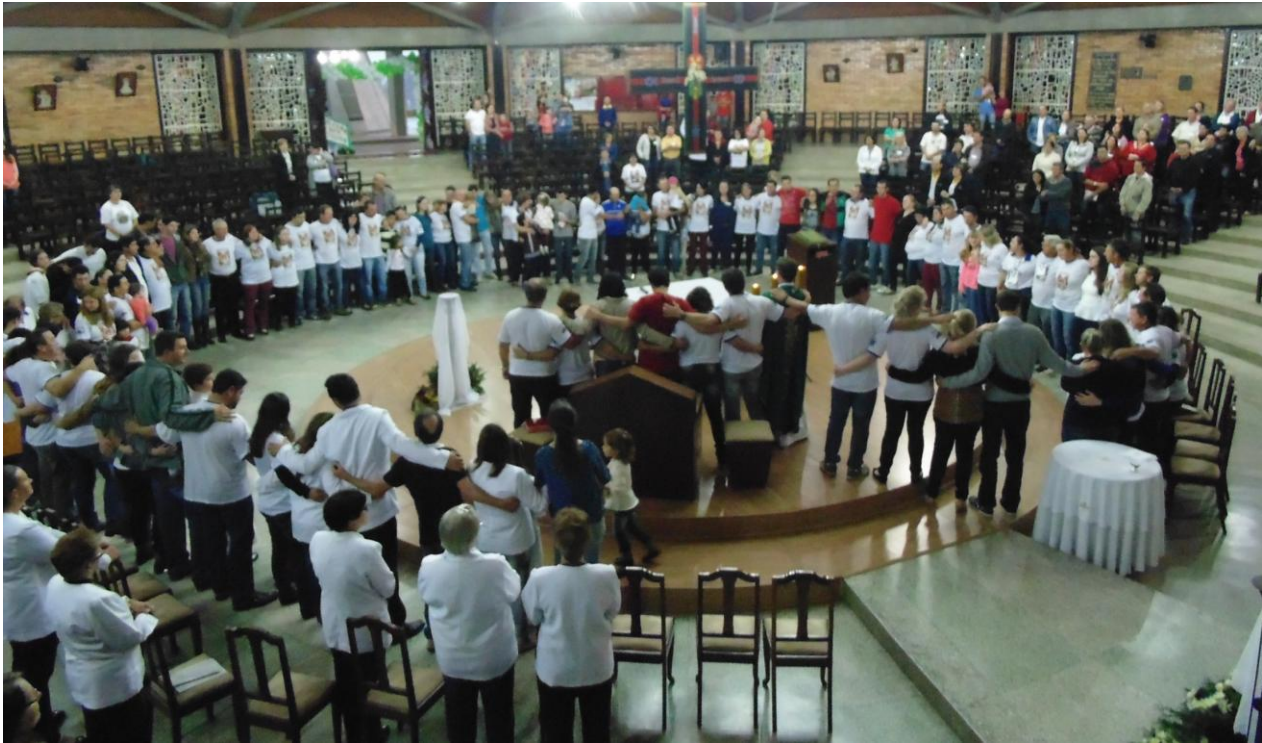
Primeiro encontro de casais na Paróquia Nossa Senhora Aparecida de Rio Negro.

12 a 18 de outubro de 2015 – Ano 2015 – n.º 96 www.diocesesp.org.br / aed@diocesesp.org.br