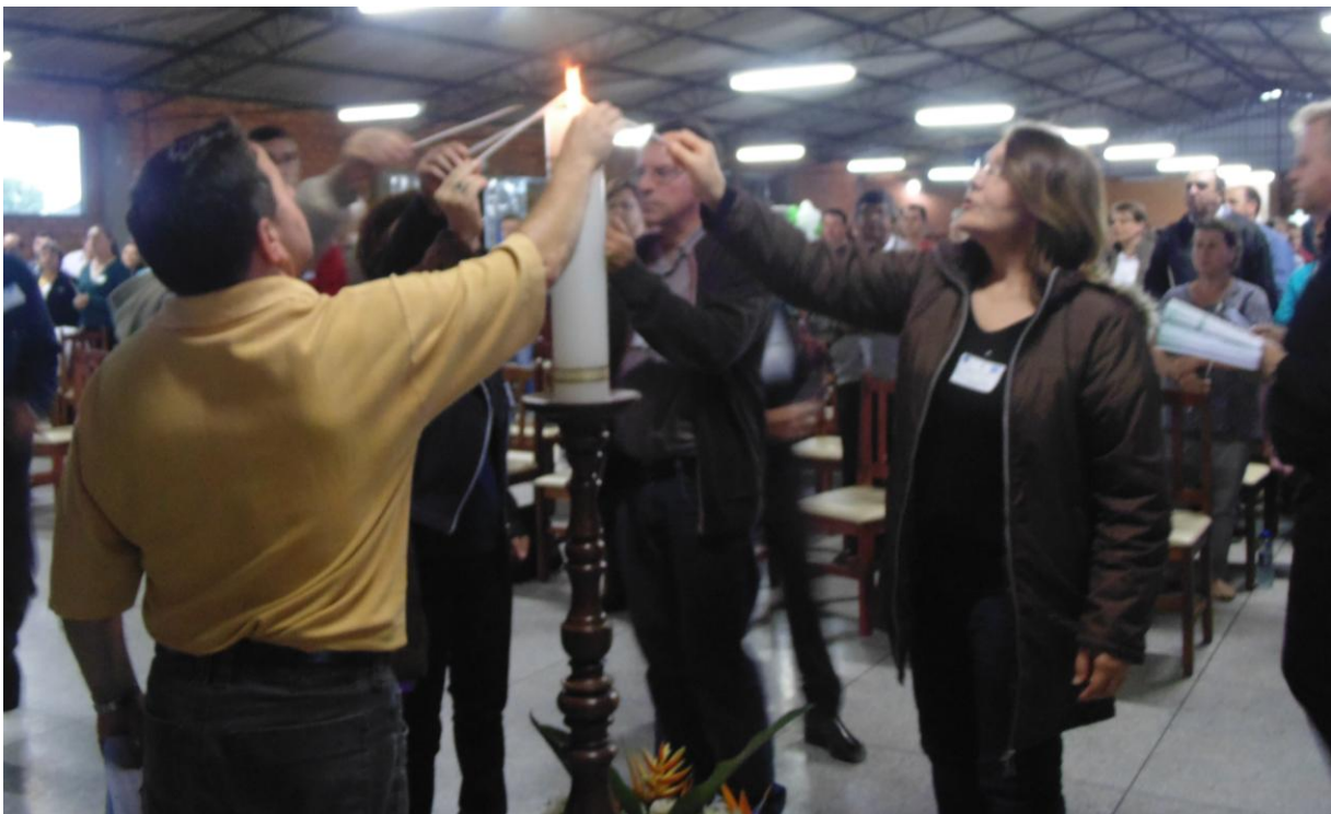
Paróquia Nossa Senhora Aparecida - Rio Negro.