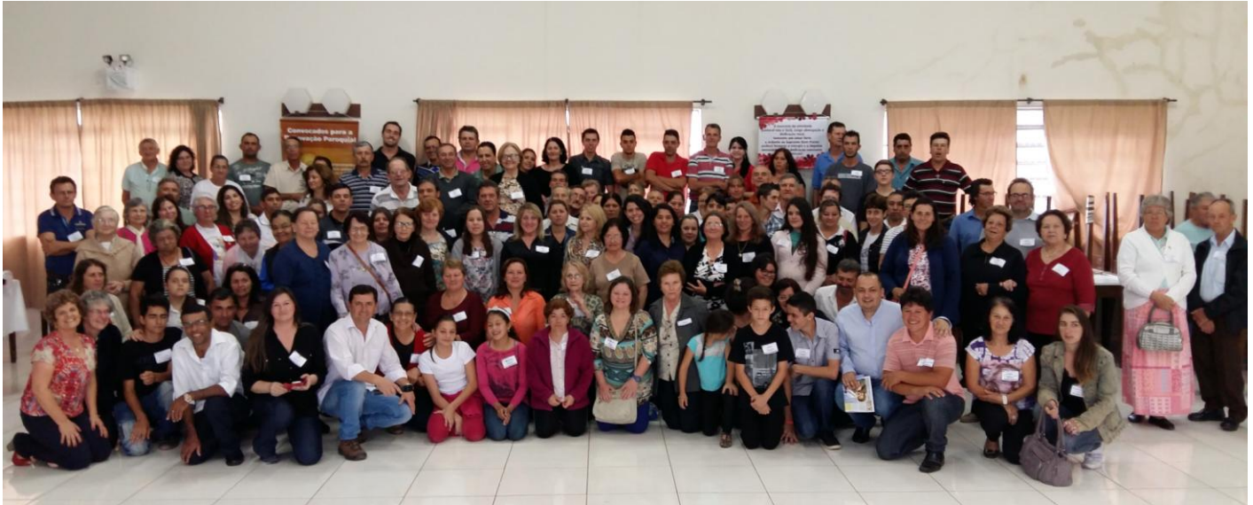
Paróquia Senhor Bom Jesus da Coluna em Rio Negro.

12 a 18 de outubro de 2015 – Ano 2015 – n.º 96 www.diocesesp.org.br / aed@diocesesp.org.br