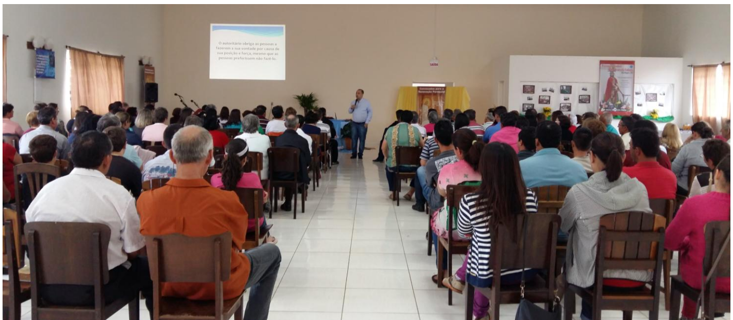
Paróquia Senhor Bom Jesus da Coluna em Rio Negro.