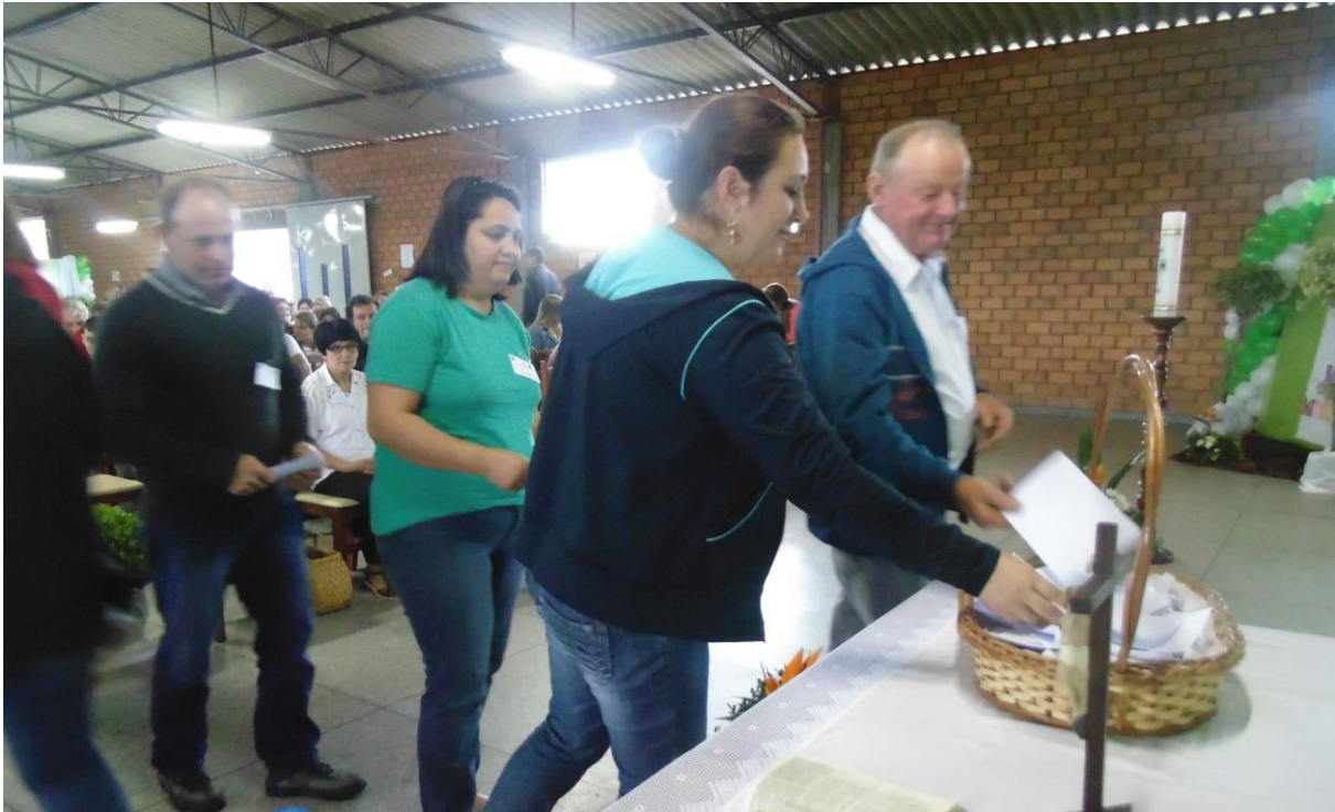
Paróquia Nossa Senhora Aparecida - Rio Negro.

12 a 18 de outubro de 2015 – Ano 2015 – n.º 96 www.diocesesp.org.br / aed@diocesesp.org.br