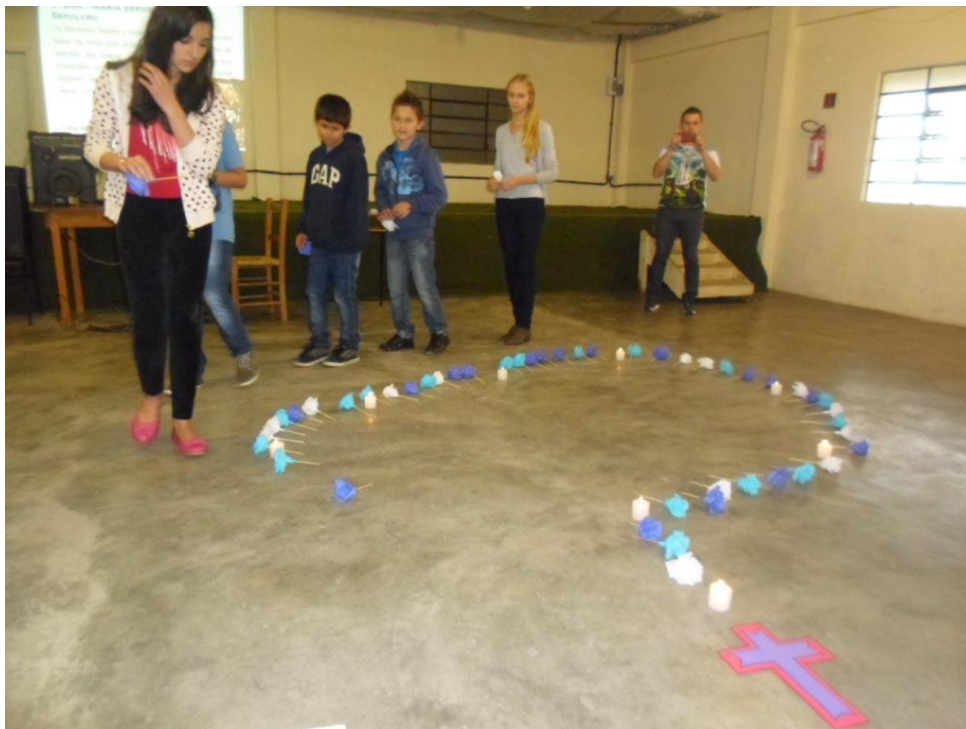
Encontro Juvenil - Paróquia Imaculada Conceição Catanduvas do Sul.

12 a 18 de outubro de 2015 – Ano 2015 – n.º 96 www.diocesesp.org.br / aed@diocesesp.org.br