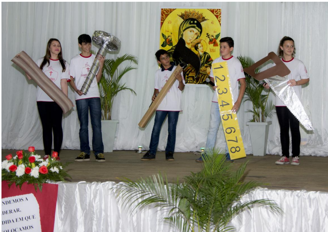
Paróquia Nossa Senhora do Perpétuo Socorro - Araucária.