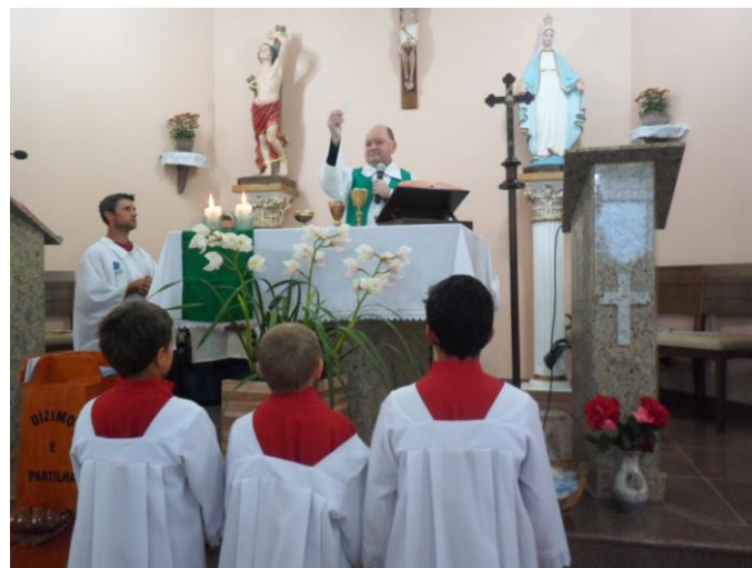
Encontro Juvenil - Paróquia Imaculada Conceição Catanduvas do Sul.