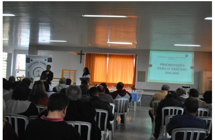
3ª Assembleia Diocesana da Pastoral Familiar.