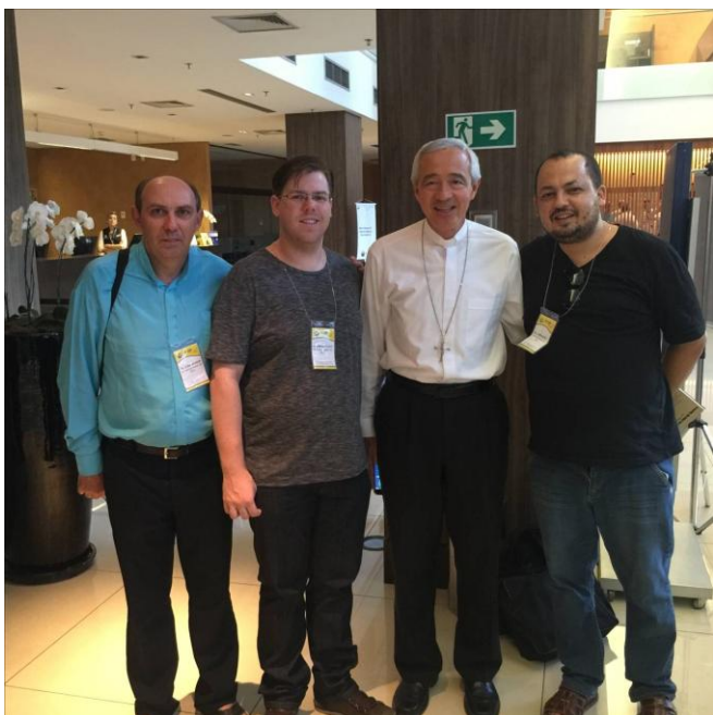
ENCONTRO NACIONAL DOS PRESBÍTEROS