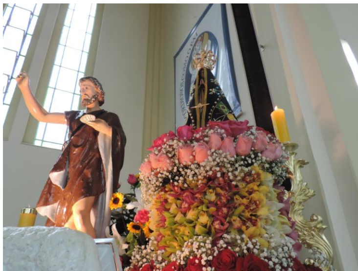
Paróquia São João Batista de Contenda

27 de junho a 03 de julho de 2016 – Ano 2016 – n.º 119 www.diocesespj.org.br / aed@diocesespj.org.br