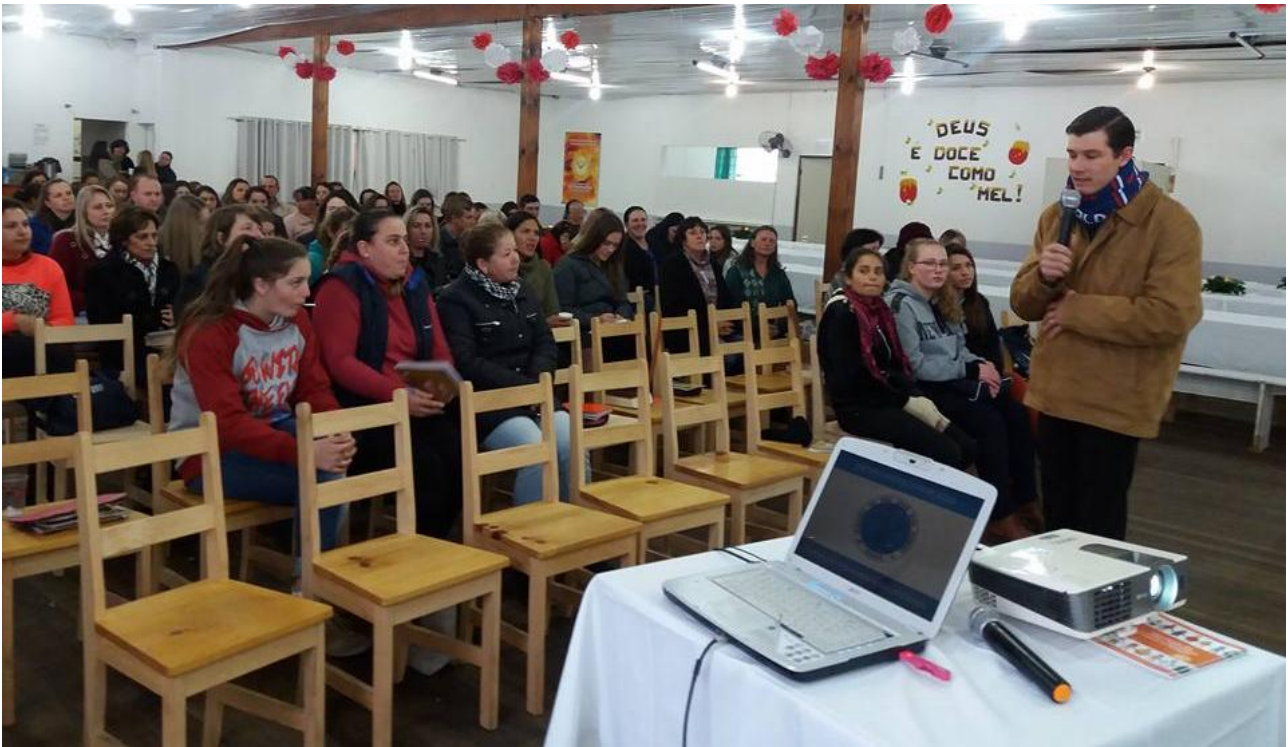
Paróquia Nossa Senhora das Graças de Piên.

27 de junho a 03 de julho de 2016 – Ano 2016 – n.º 119 www.diocesespj.org.br / aed@diocesespj.org.br