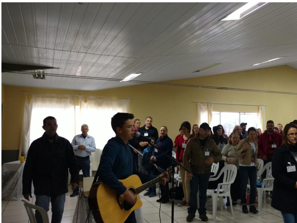
Escola Diocesana de Ministérios Setor I

27 de junho a 03 de julho de 2016 – Ano 2016 – n.º 119 www.diocesespj.org.br / aed@diocesespj.org.br