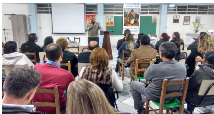
13º retiro para casais em 2ª união.