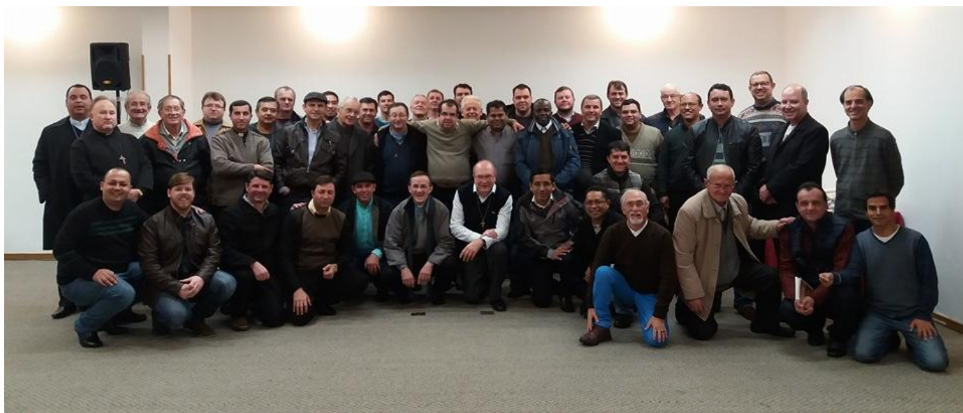
23 e 24 de junho - Formação Permanente para os presbíteros.

27 de junho a 03 de julho de 2016 – Ano 2016 – n.º 119 www.diocesespj.org.br / aed@diocesespj.org.br