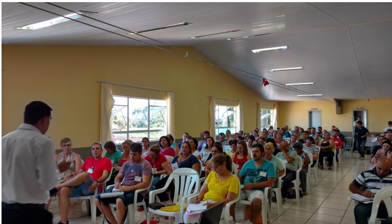
Segundo Encontro da Escola Diocesana de Ministérios Setor I

27 de junho a 03 de julho de 2016 – Ano 2016 – n.º 119 www.diocesespj.org.br / aed@diocesespj.org.br