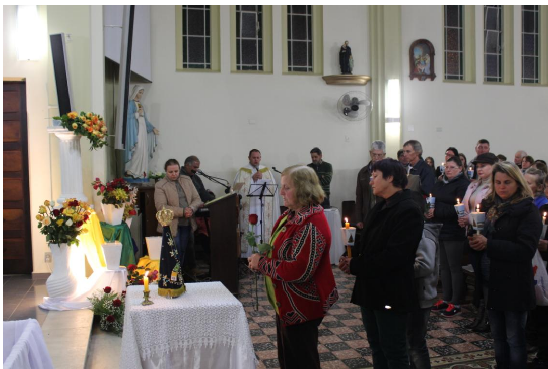
Paróquia São João Batista de Contenda

27 de junho a 03 de julho de 2016 – Ano 2016 – n.º 119 www.diocesespj.org.br / aed@diocesespj.org.br