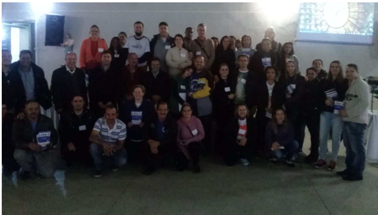
Paróquia Nossa Senhora Auxiliadora.

22 a 28 de agosto de 2016 – Ano 2016 – n.º 125 www.diocesespj.org.br / aed@diocesespj.org.br