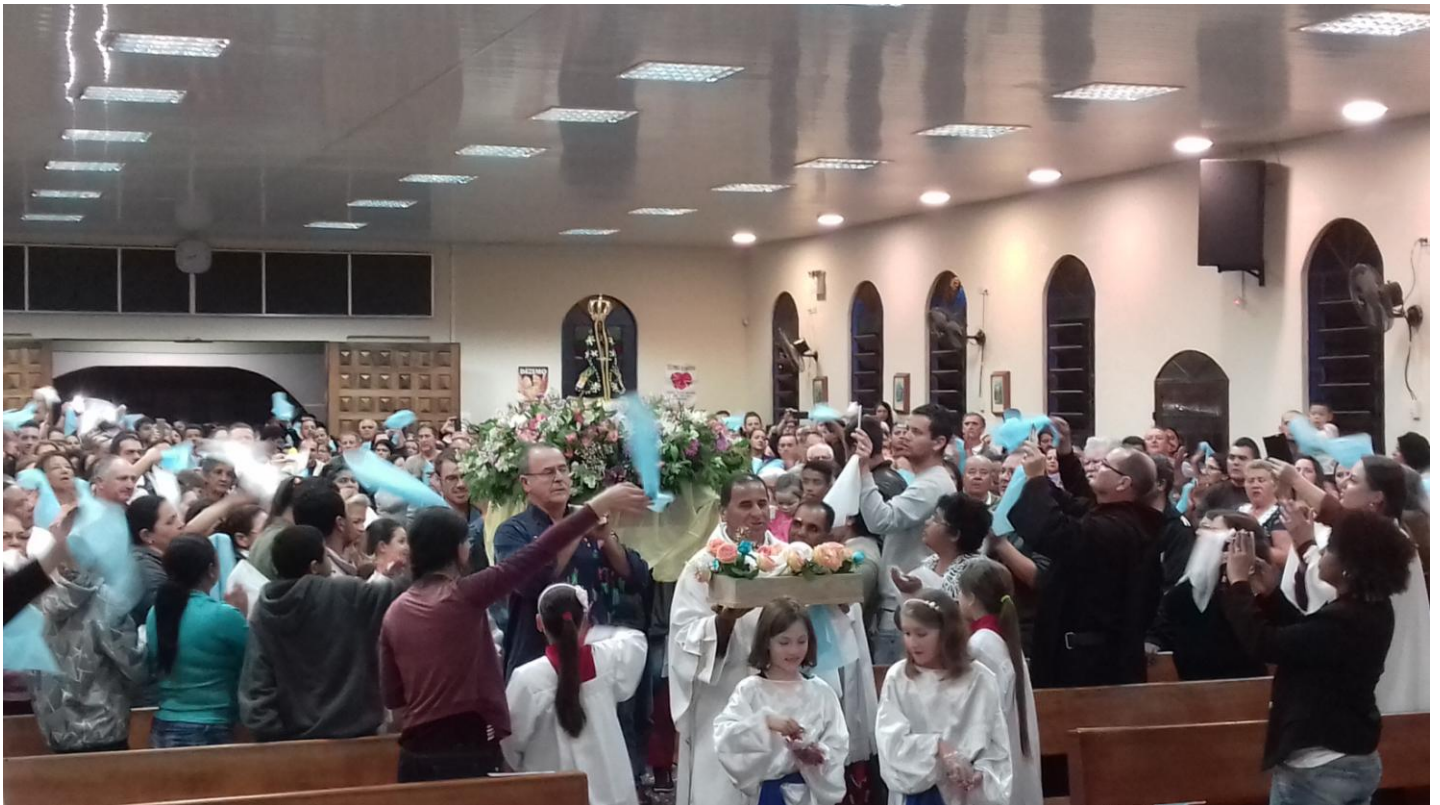
Paróquia Nossa Senhora de Fátima - Fazenda Rio Grande.

Domingo foi o encerramento da visita de Nossa Senhora com uma grandiosa carreta de mais ou menos 300 carros e dois ônibus saindo da Comunidade São Francisco, passando pela Matriz e demais Comunidades até chegar na Comunidade São Sebastião. Ali no Salão Paroquial foi celebrada a Santa Missa com umas 1.200 pessoas. É inenarrável a emoção que tomou conta de todos ao final da celebração à luz de velas fizeram a Consagração à Nossa Senhora.