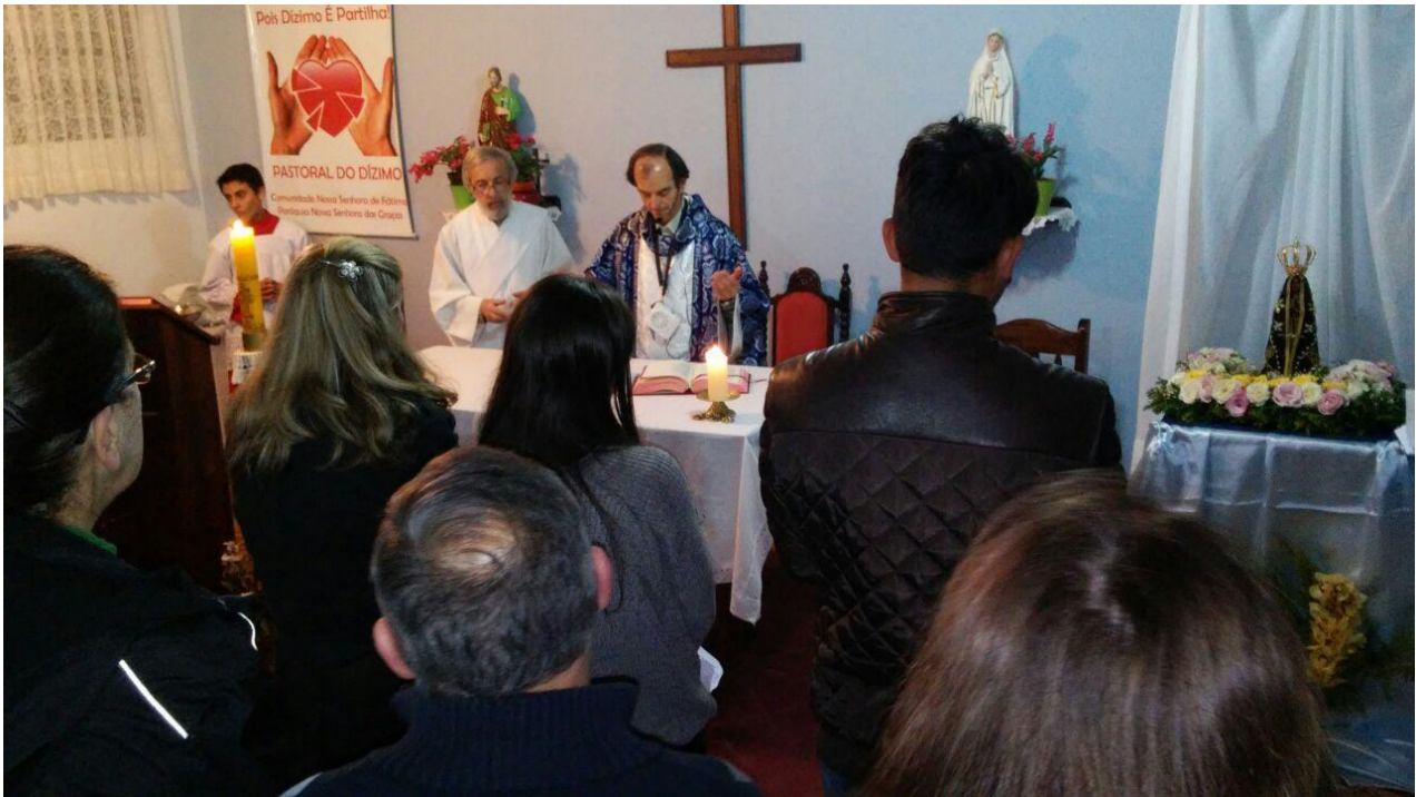
Paróquia Nossa Senhora das Graças - Fazenda Rio Grande.