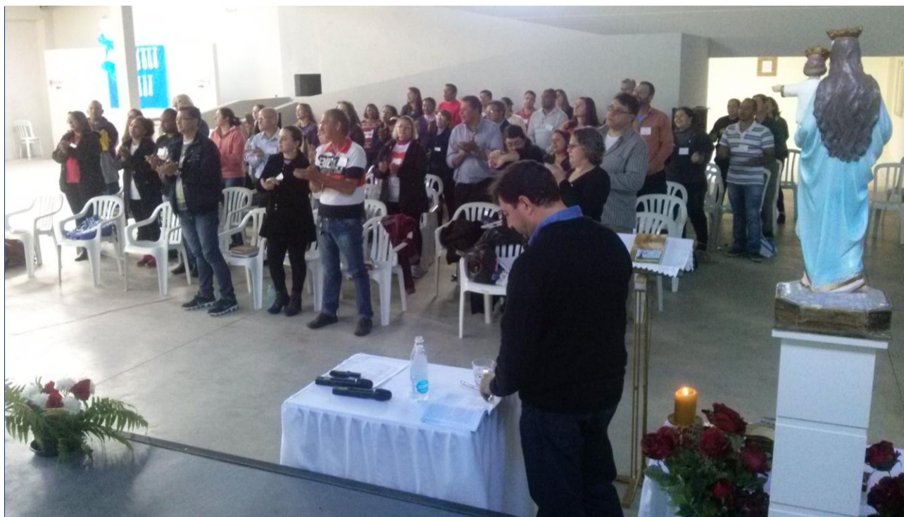
Paróquia Nossa Senhora Auxiliadora.

22 a 28 de agosto de 2016 – Ano 2016 – n.º 125 www.diocesesjp.org.br / aed@diocesesjp.org.br