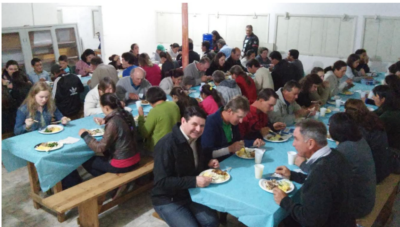
Paróquia Nossa Senhora da Conceição - Agudos do Sul.