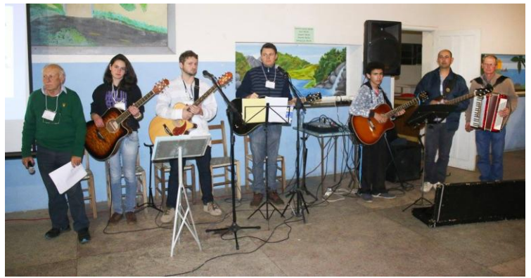
Paróquia Imaculada Conceição - Mariental.