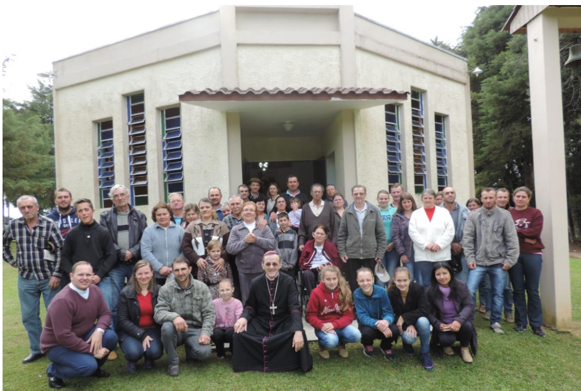
CAPELA SÃO SEBASTIÃO - FUNDO DO MATO.