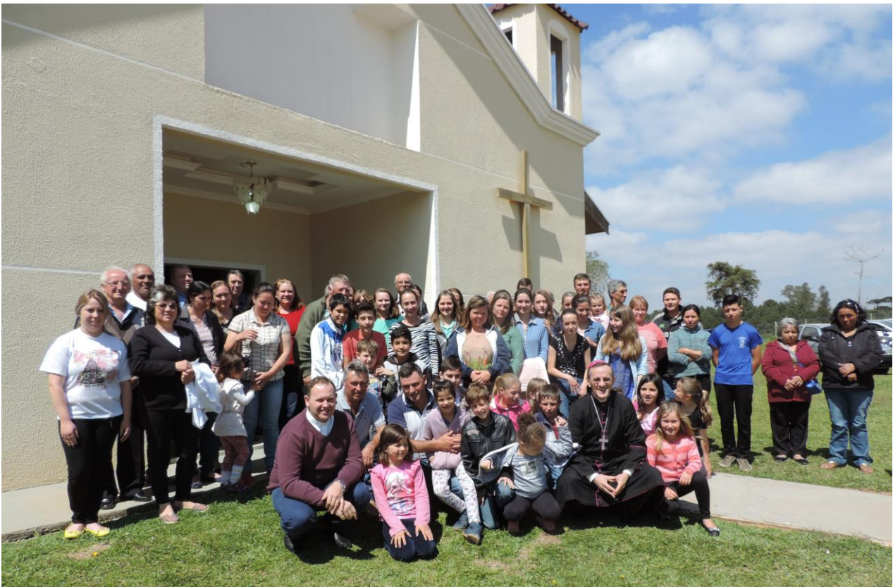
CAPELA SENHOR BOM JESUS - CAMPESTRE.