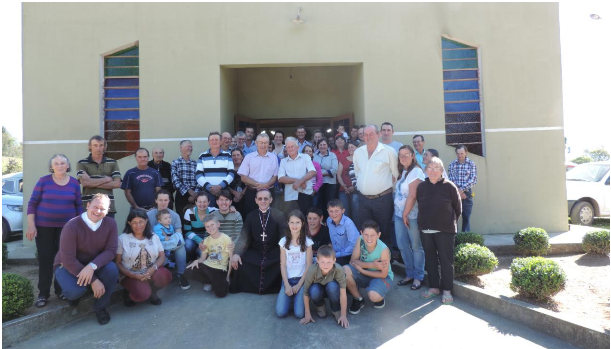
CAPELA SÃO PEDRO - COLÔNIA SANTANA.