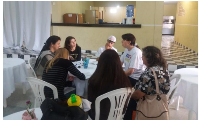
Grupo de estudo.