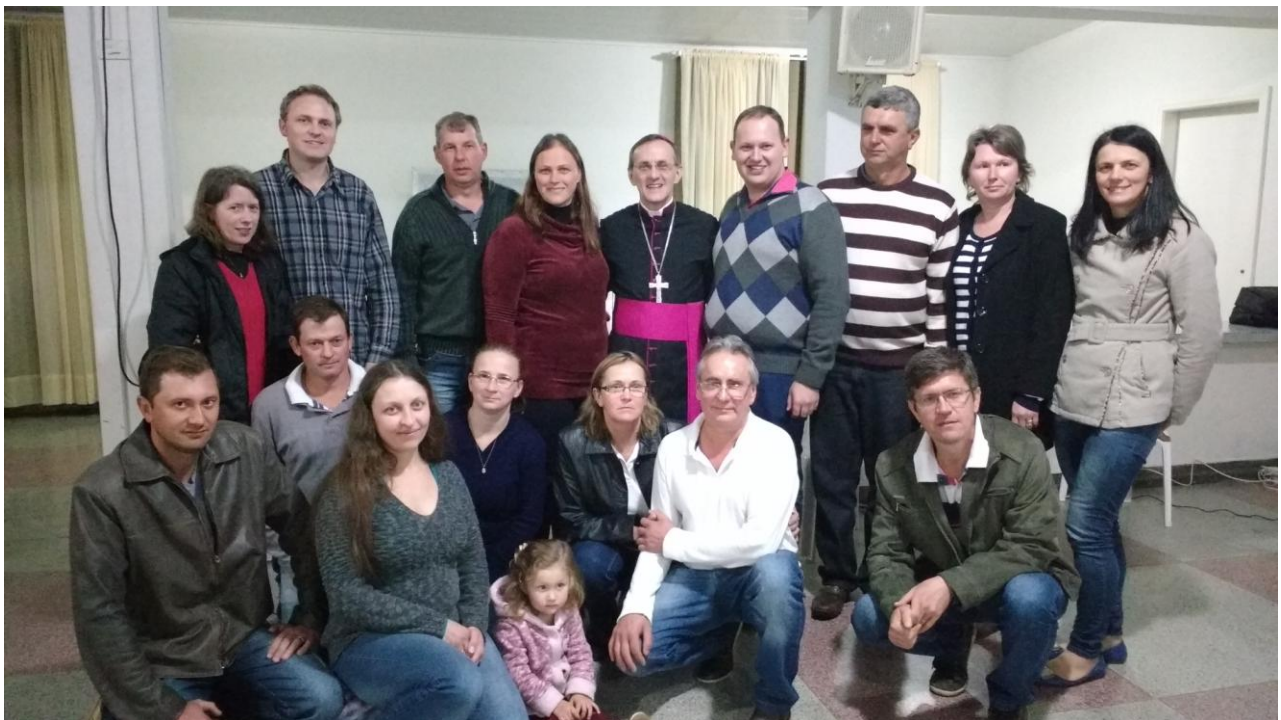
EEAE DA MATRIZ - PARÓQUIA SÃO JOÃO BATISTA - CONTENDA