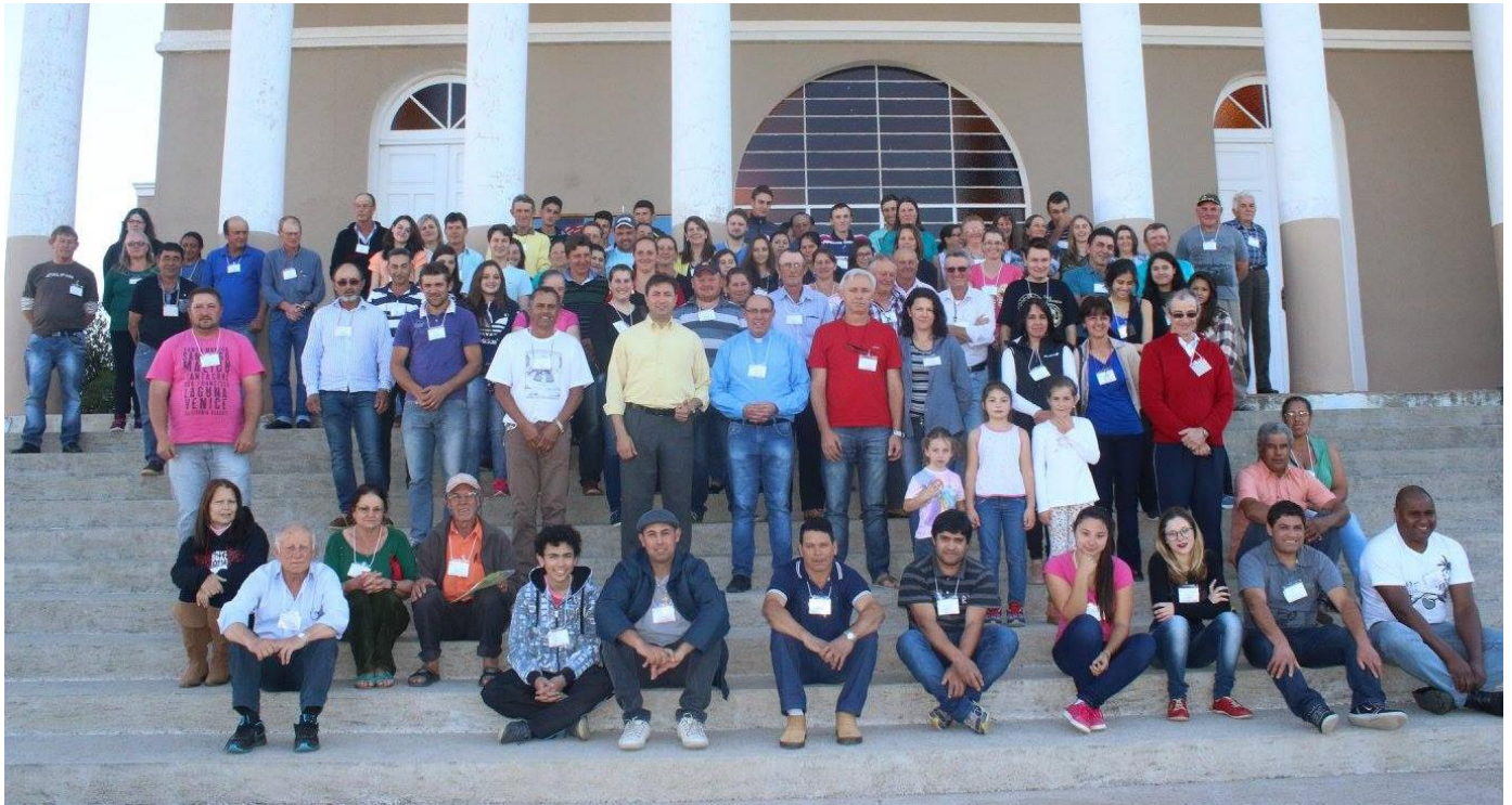
Paróquia Imaculada Conceição - Mariental.

19 a 25 de setembro de 2016 – Ano 2016 – n.º 129 www.diocesesp.org.br / aed@diocesesp.org.br