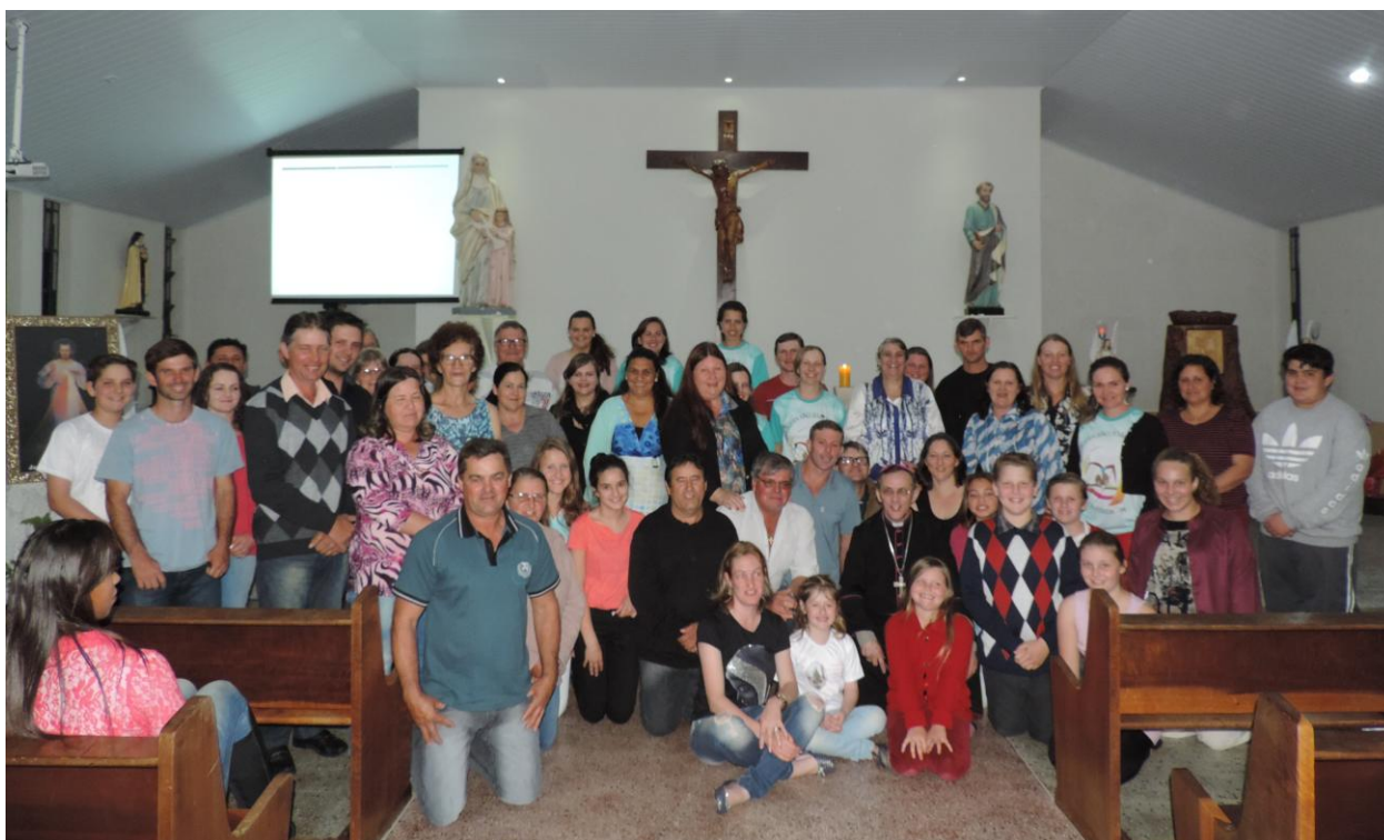
CAPELA SANTA ANA - SÃO PEDRO.