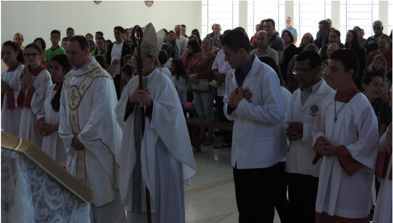
CAPELA NOSSA SENHORA DAS GRAÇAS - JARDIM PLANALTO.

www.diocesesp.org.br / aed@diocesesp.org.br