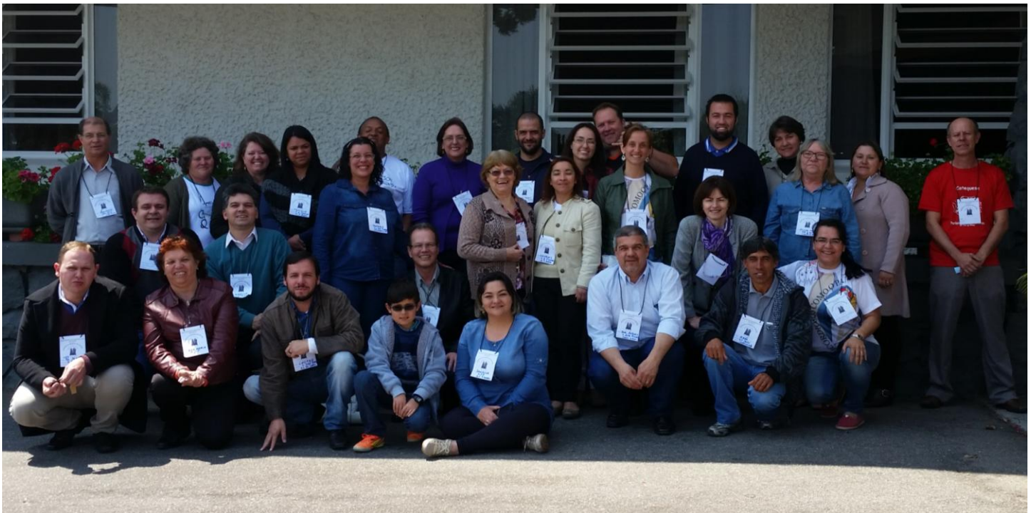
Participantes da Diocese de São José dos Pinhais.