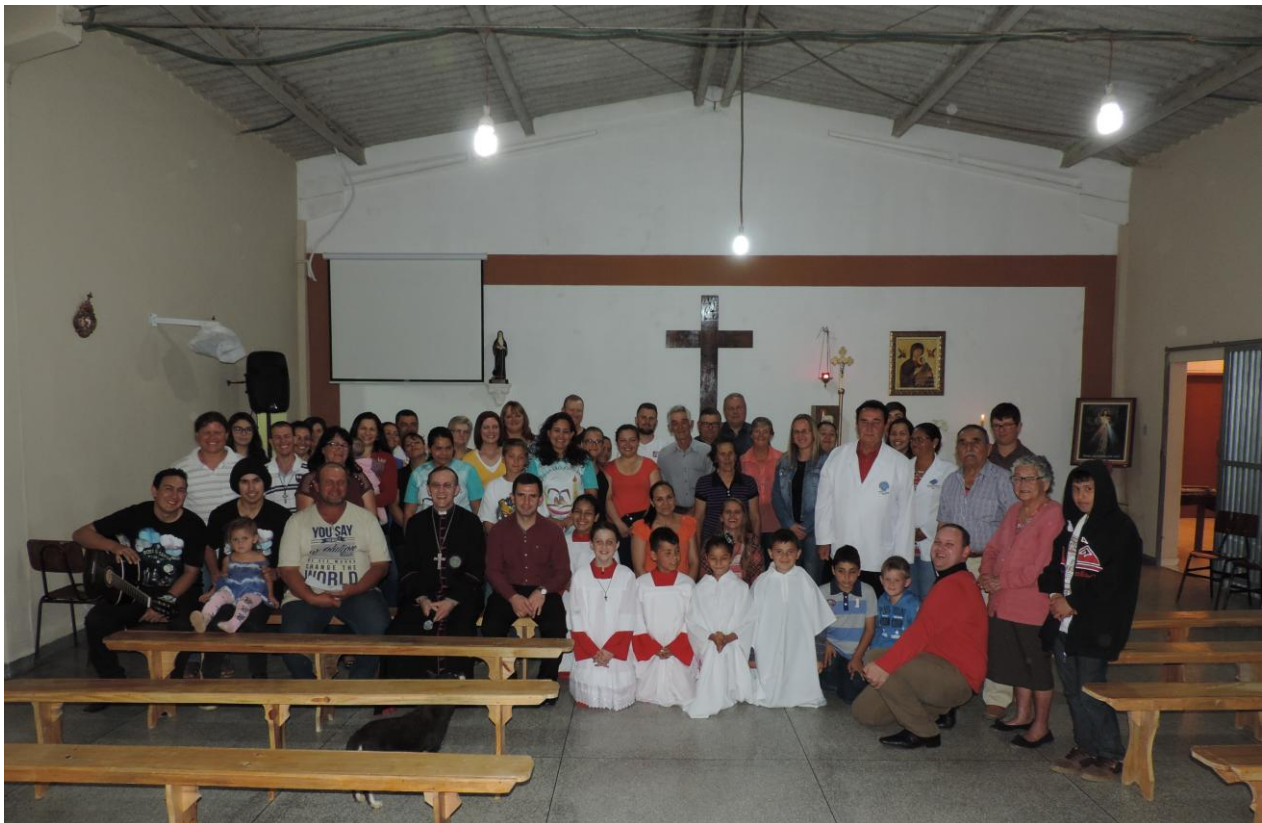
CAPELA SÃO BENTO - JARDIM ITAPIRUBÁ.