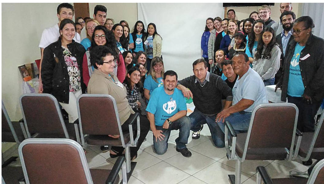
Catequistas - Paróquia São Marcos