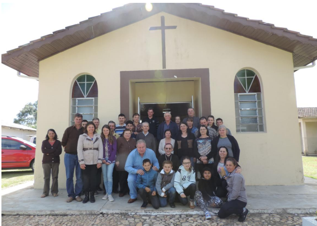
CAPELA SÃO ROQUE - ITAGASSAVA.

www.diocesesp.org.br / aed@diocesesp.org.br