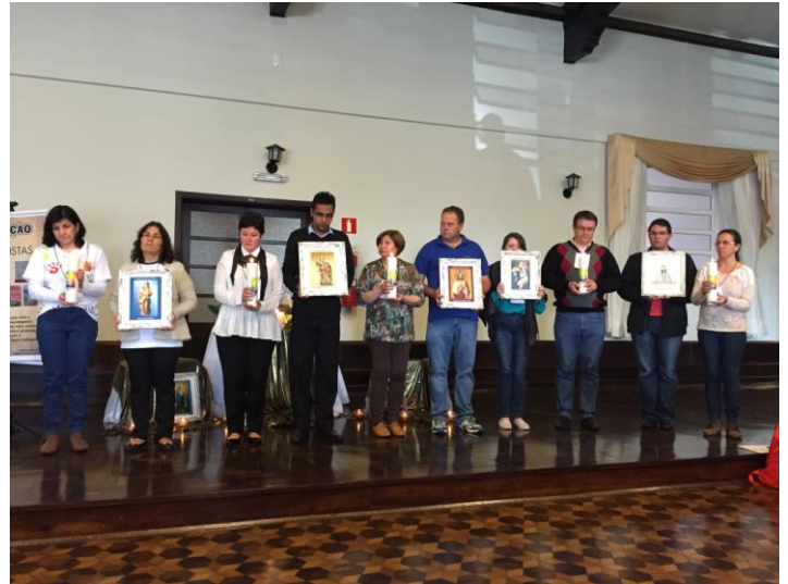
Ao final do encontro os coordenadores diocesanos receberam como símbolo de envio: uma vela e um quadro com a imagem do(a) padroeiro(a) da diocese.