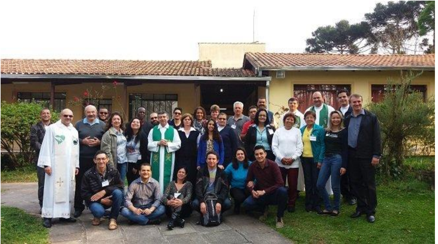
Assembleia Regional da Pastoral Carcerária - Participantes das (arqui) dioceses do Paraná.

19 a 25 de setembro de 2016 – Ano 2016 – n.º 129 www.diocesesp.org.br / aed@diocesesp.org.br