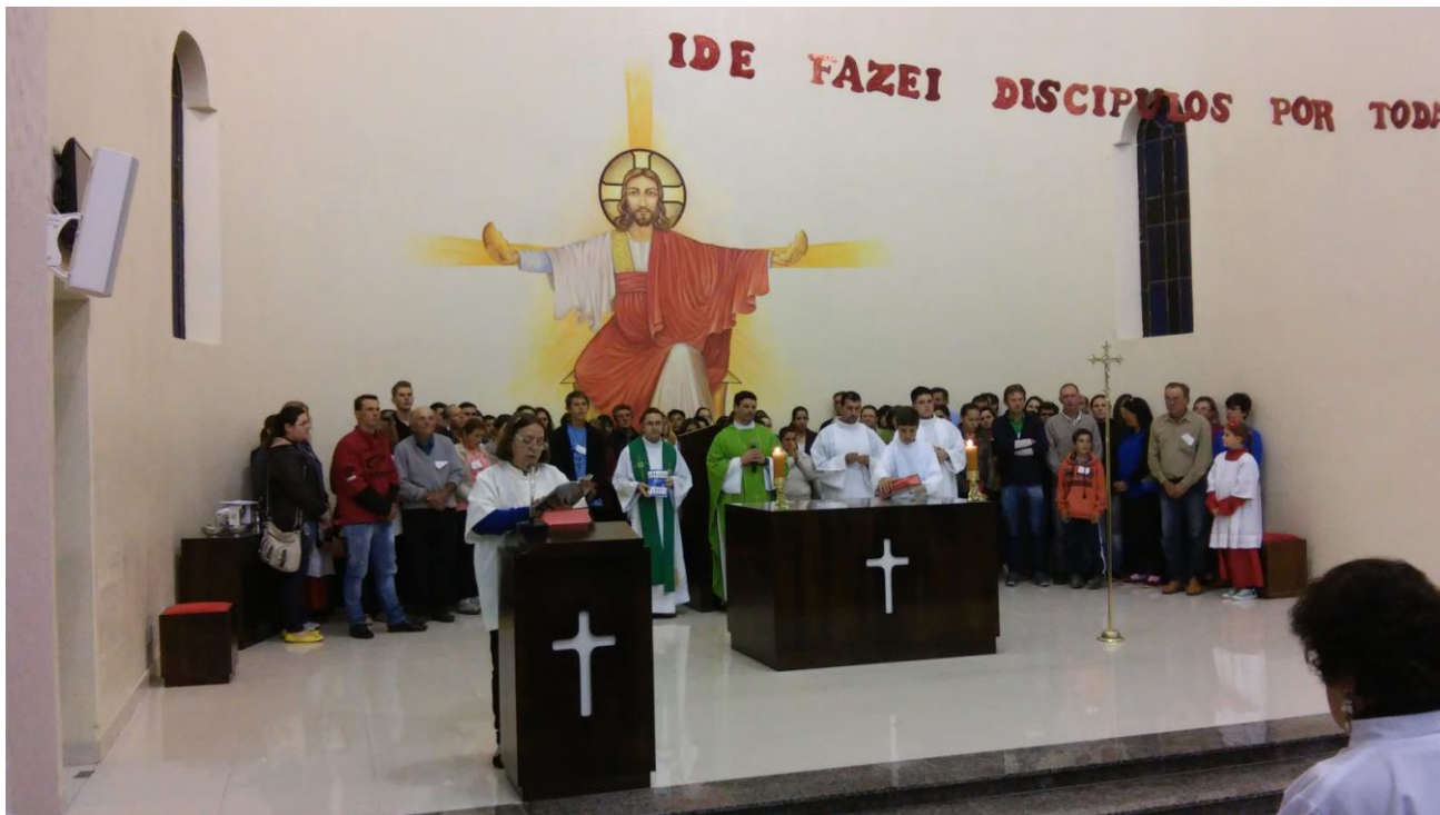
Paróquia Nossa Senhora da Conceição - Agudos do Sul.