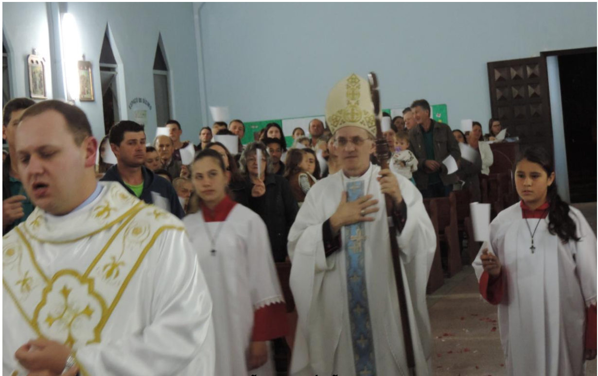
CAPELA SÃO CRISTÓVÃO - TREVO.

19 a 25 de setembro de 2016 – Ano 2016 – n.º 129 www.diocesesp.org.br / aed@diocesesp.org.br