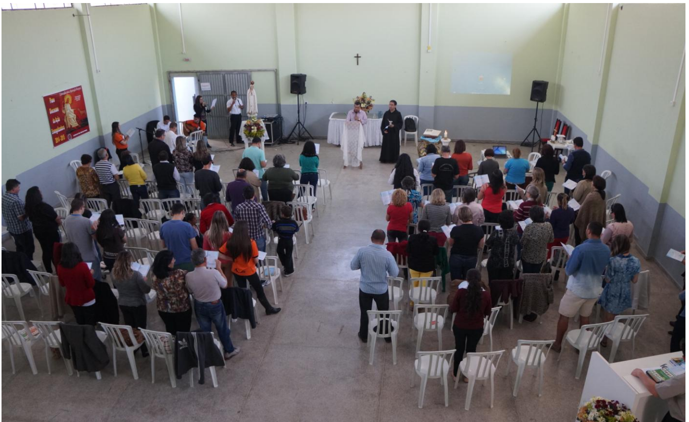
Paróquia Nossa Senhora de Fátima - Fazenda Rio Grande.