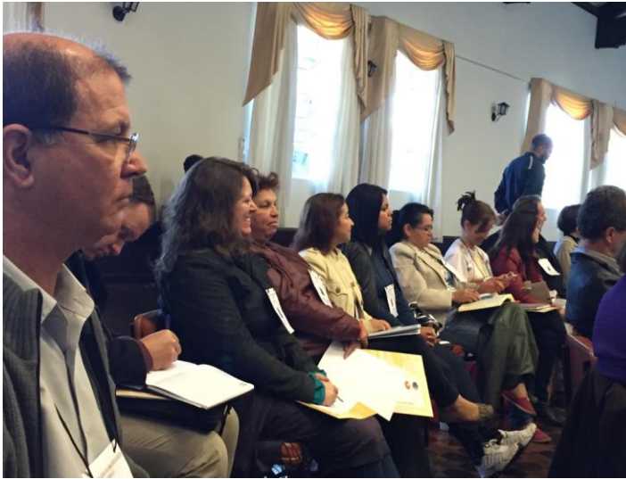
Participantes da diocese de São José dos Pinhais.

19 a 25 de setembro de 2016 – Ano 2016 – n.º 129 www.diocesesp.org.br / aed@diocesesp.org.br