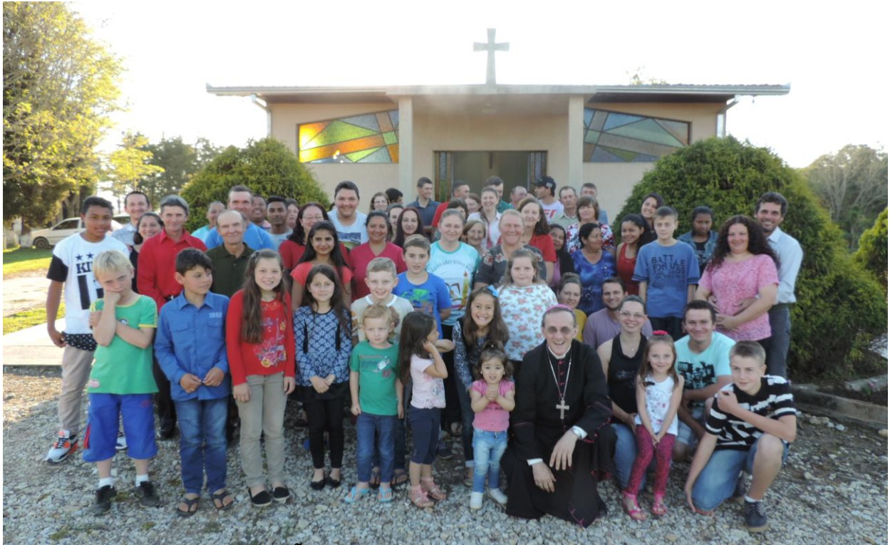
CAPELA SÃO VICENTE DE PAULO - PASSO DA CRUZ.

www.diocesesp.org.br / aed@diocesesp.org.br