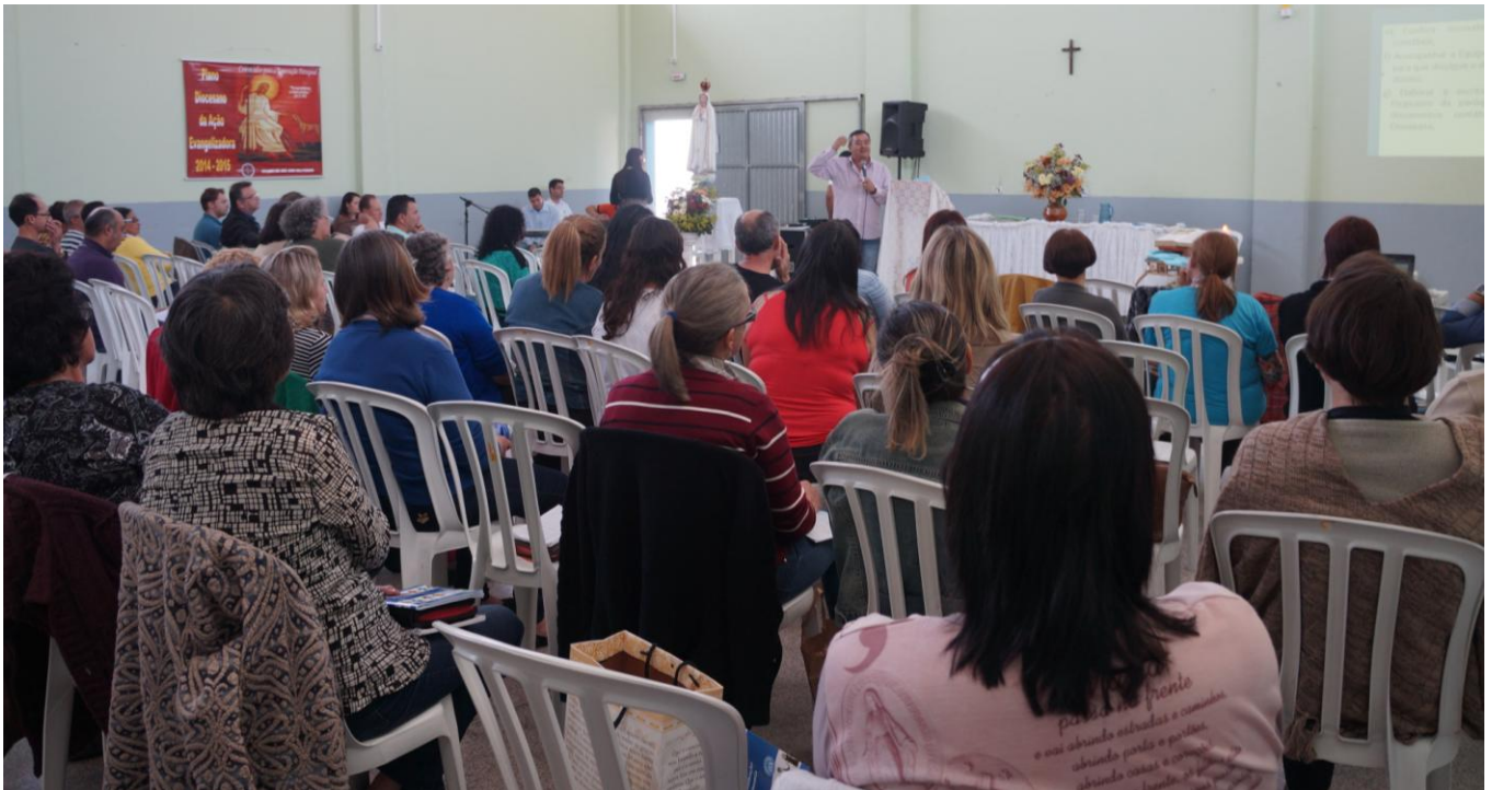
Paróquia Nossa Senhora de Fátima - Fazenda Rio Grande.