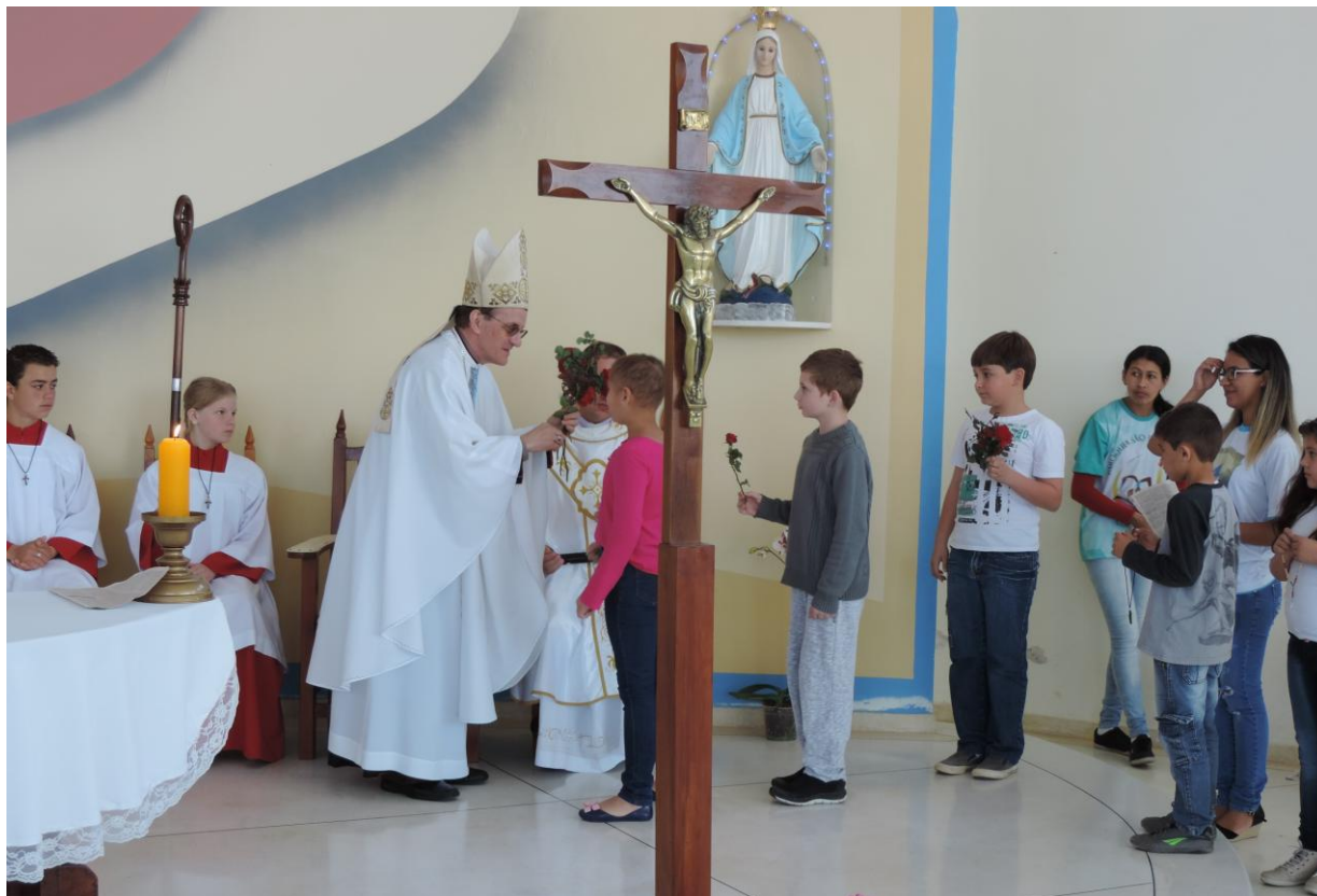
CAPELA NOSSA SENHORA DAS GRAÇAS - JARDIM PLANALTO.