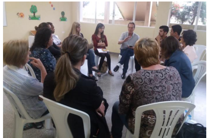
Reunião com os coordenadores e formadores.