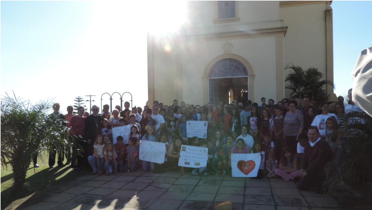
CAPELA SANTA ANA - SERRINHA.

19 a 25 de setembro de 2016 – Ano 2016 – n.º 129 www.diocesesp.org.br / aed@diocesesp.org.br