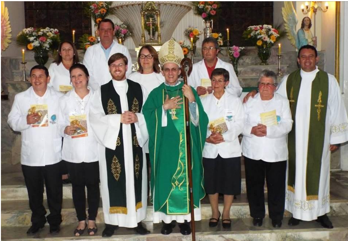
Paróquia Nossa Senhora Aparecida - Rio Negro.

19 de dezembro de 2016 a 01 de janeiro de 2017 – Ano 2016 – n.º 138 www.diocesesjp.org.br / aed@diocesesjp.org.br