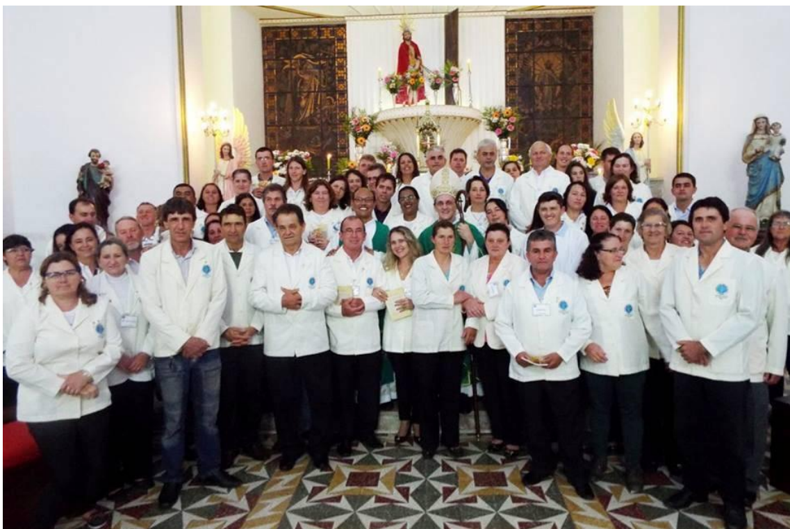
Paróquia Senhor Bom Jesus da Cana Verde - Quitandinha.