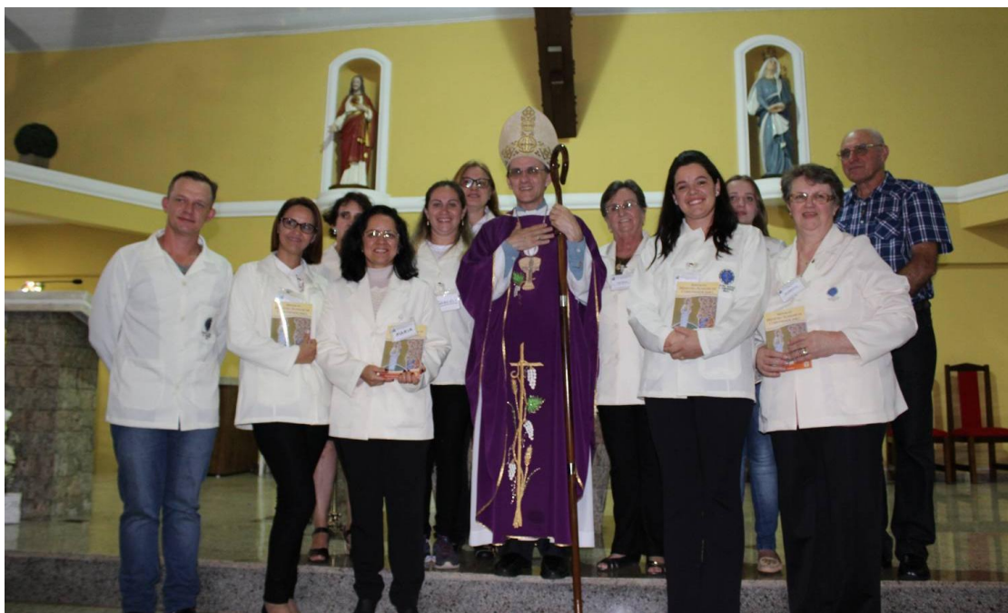
Paróquia Nossa Senhora do Perpétuo Socorro - Araucária.