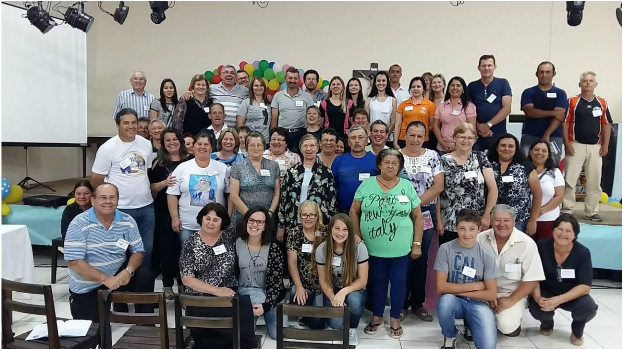
Paróquia do Senhor Bom Jesus da Coluna em Rio Negro.

19 de dezembro de 2016 a 01 de janeiro de 2017 – Ano 2016 – n.º 138 www.diocesesp.org.br / aed@diocesesp.org.br