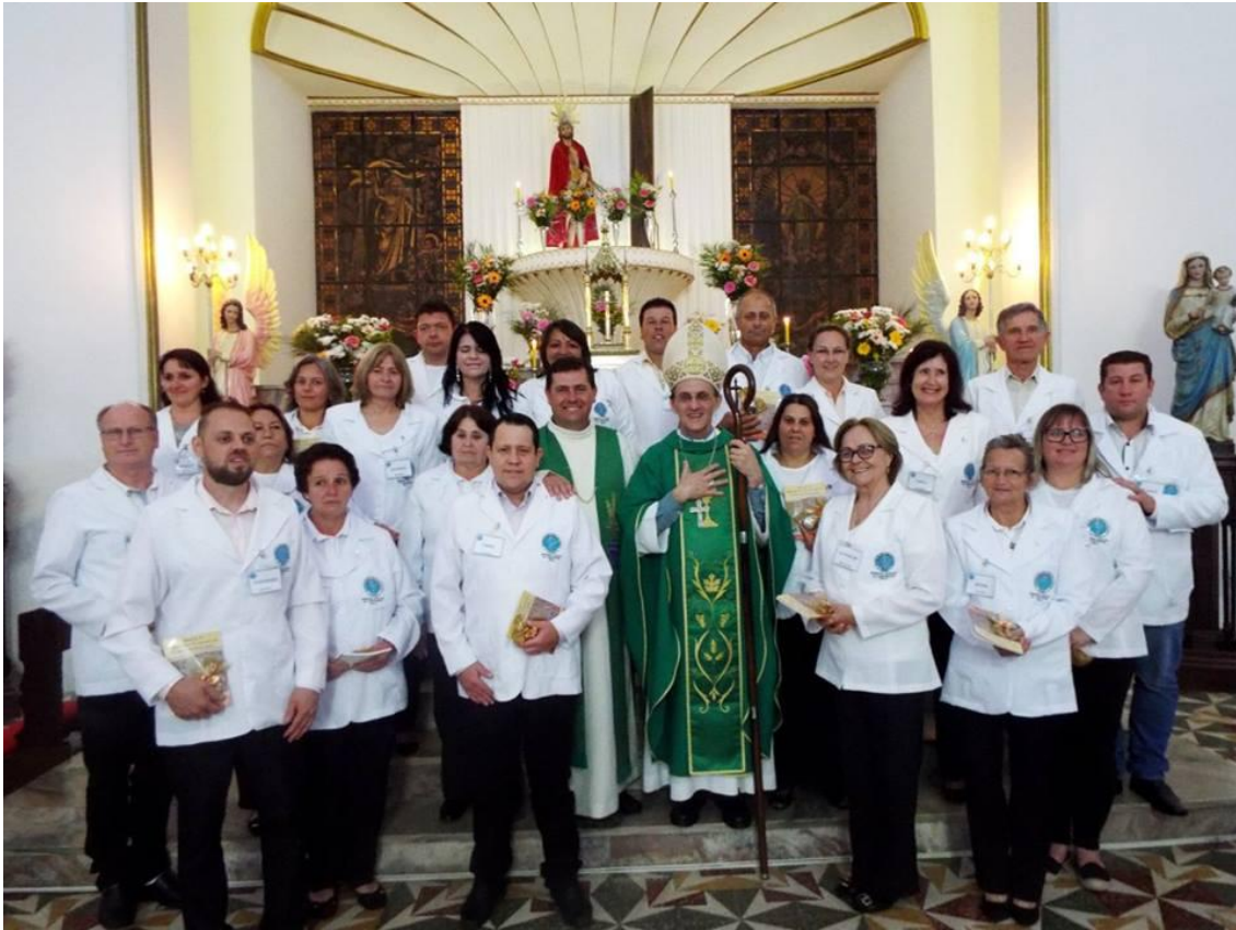
Paróquia Senhor Bom Jesus da Coluna - Rio Negro.

19 de dezembro de 2016 a 01 de janeiro de 2017 – Ano 2016 – n.º 138 www.diocesesjp.org.br / aed@diocesesjp.org.br