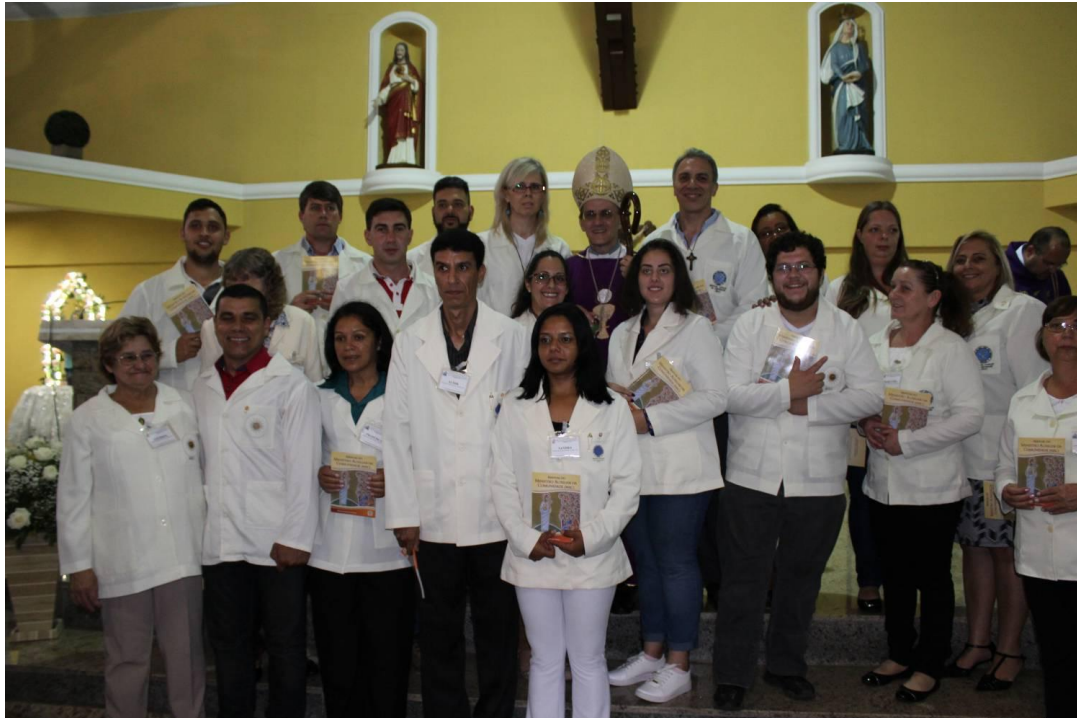
Paróquia Nossa Senhora das Dores - Araucária.