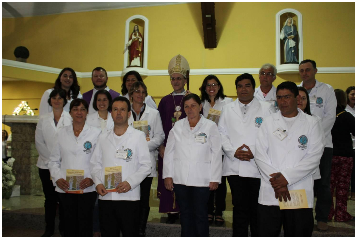
Paróquia Santo Antônio - Lapa.

www.diocesespj.org.br / aed@diocesespj.org.br