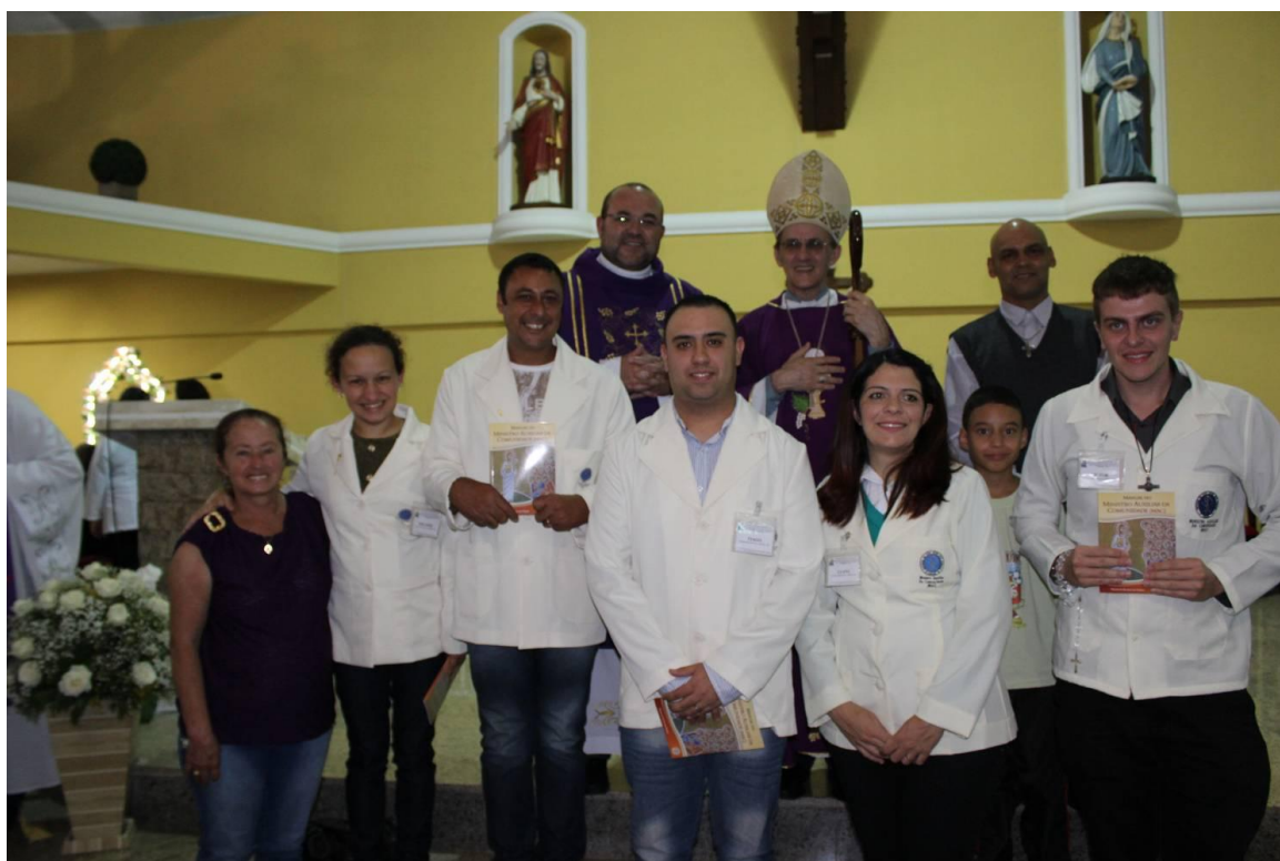
Paróquia Senhor Bom Jesus - Araucária.