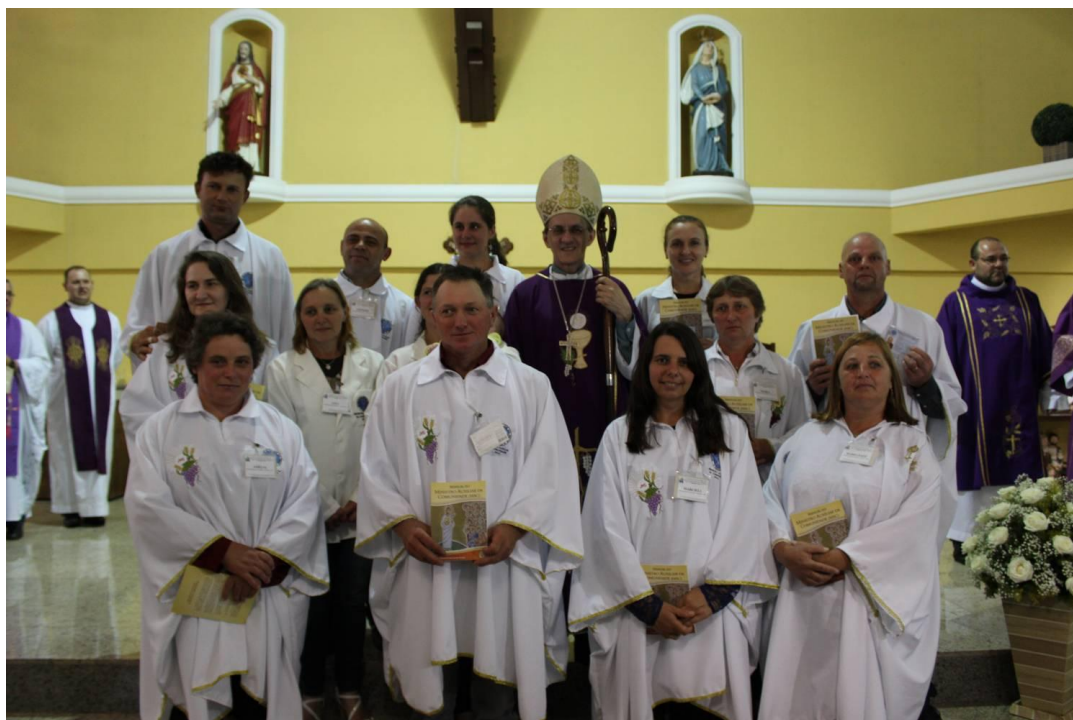
Paróquia Imaculada Conceição - Catanduvas do Sul.