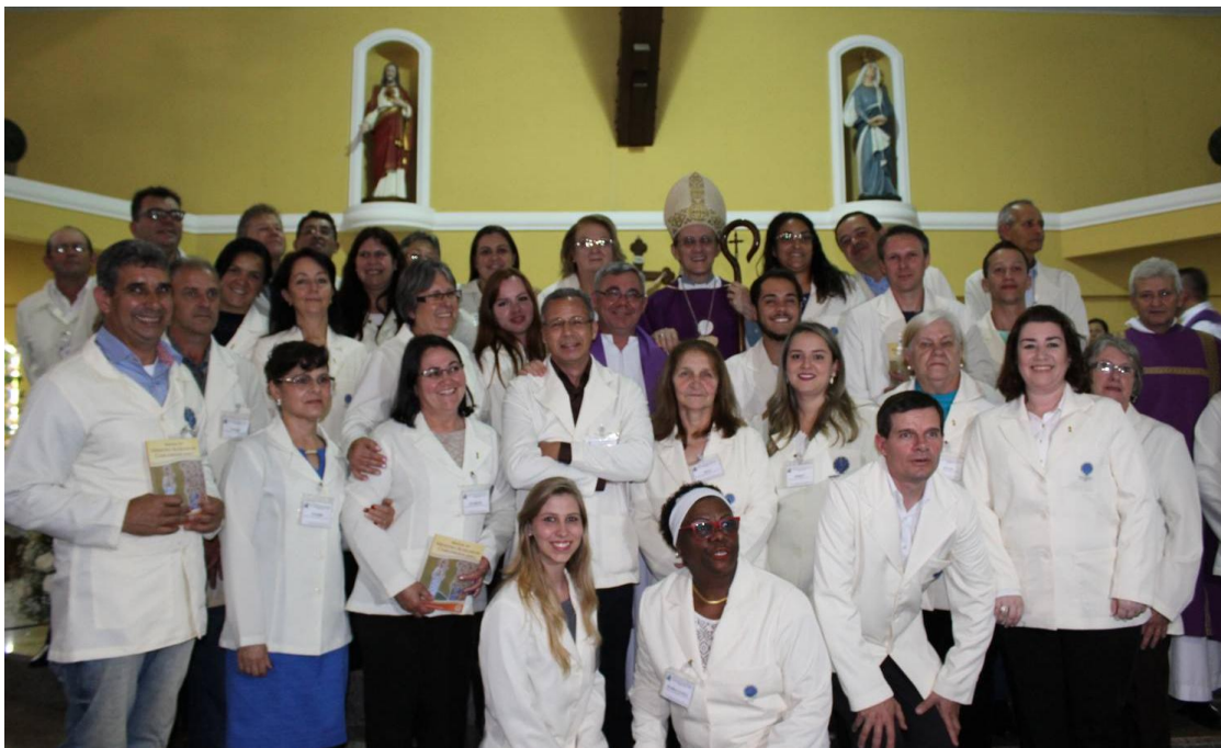
Paróquia Nossa Senhora dos Remédios - Araucária.

19 de dezembro de 2016 a 01 de janeiro de 2017 – Ano 2016 – n.º 138 www.diocesesjp.org.br / aed@diocesesjp.org.br