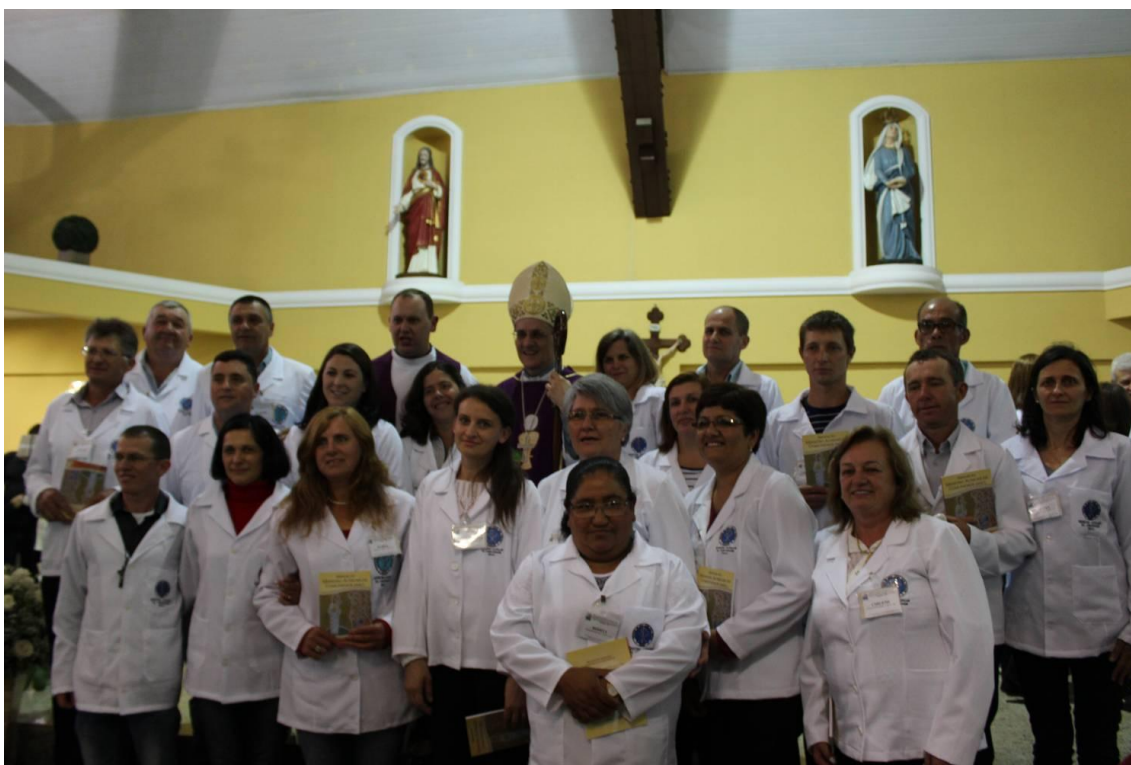
Paróquia São João Batista - Contenda.