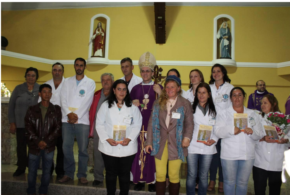
Paróquia Santos Reis - Lapa.

19 de dezembro de 2016 a 01 de janeiro de 2017 – Ano 2016 – n.º 138 www.diocesesp.org.br / aed@diocesesp.org.br