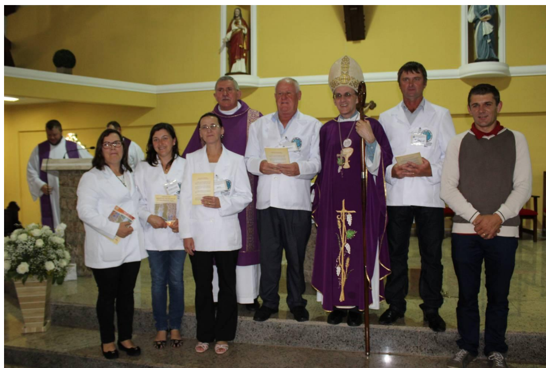
Paróquia Imaculada Conceição - Mariental.