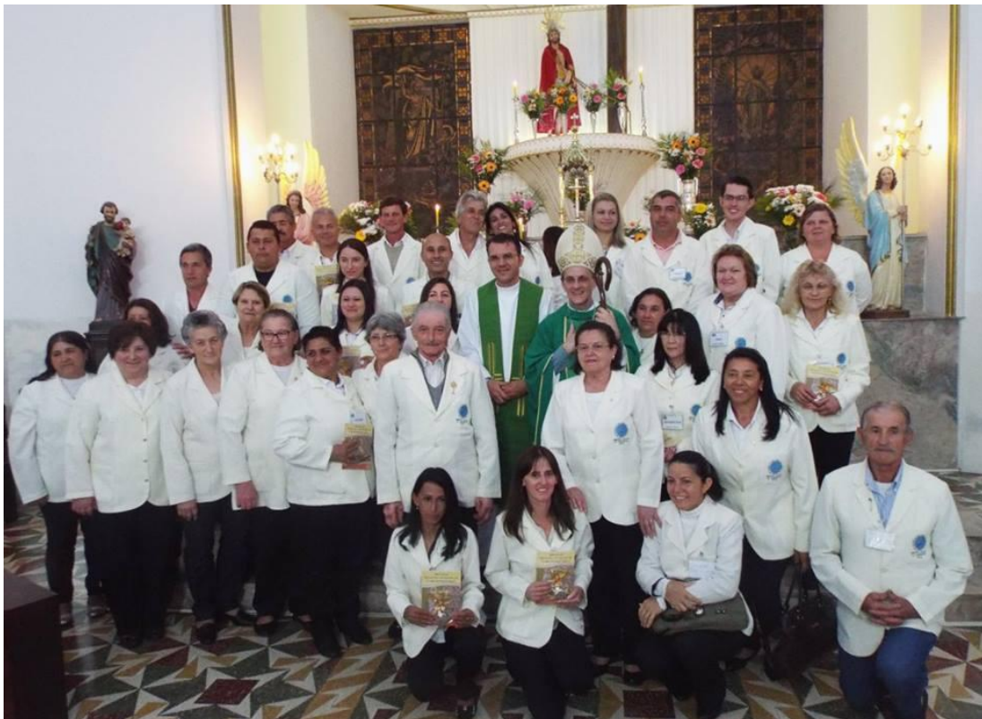
Paróquia Cristo Rei - Campo do Tenente.