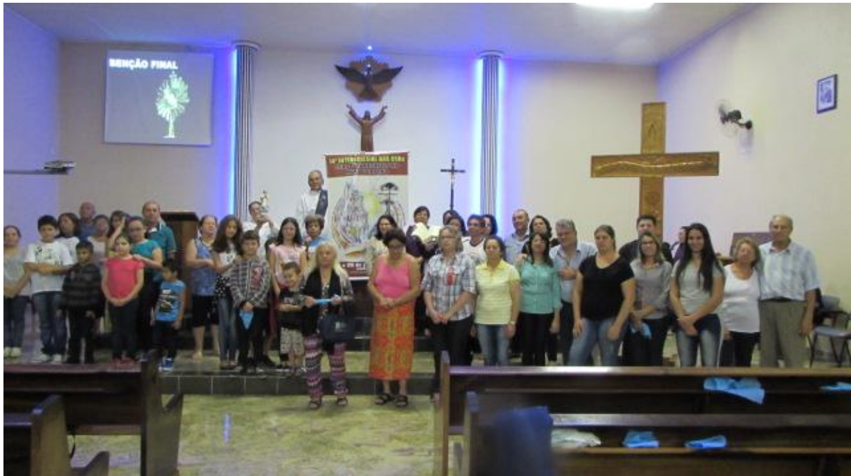
11 de março - Comunidade Divino Espírito Santo da Paróquia Nossa Senhora de Fátima - SJP.