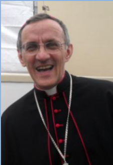
Dom Francisco Carlos Bach Bispo Diocesano

13 a 19 de fevereiro de 2017 – Ano 2017 – n.º 142 www.diocesesp.org.br / aed@diocesesp.org.br