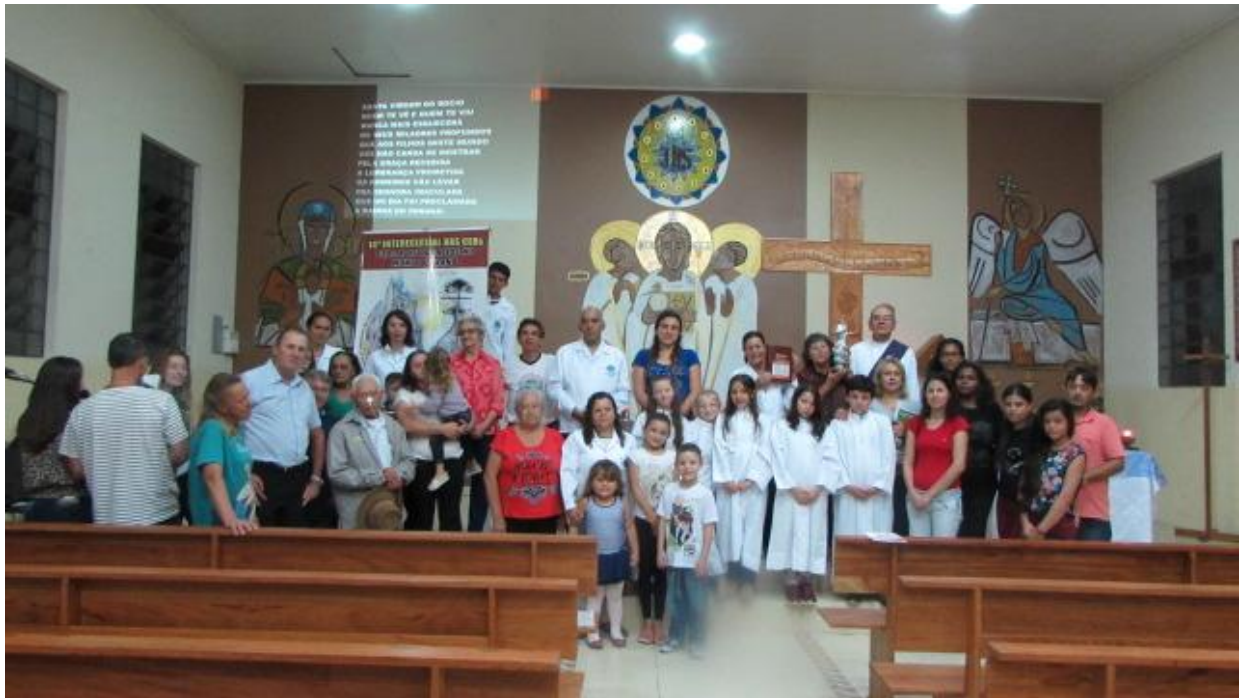
11 de março - Comunidade São Cristóvão da Paróquia Nossa Senhora de Fátima - SJP.