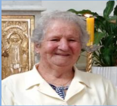
Benedita Maria MAC Paróquia Nossa Senhora dos Remédios - Araucária

13 a 19 de fevereiro de 2017 – Ano 2017 – n.º 142 www.diocesesp.org.br / aed@diocesesp.org.br