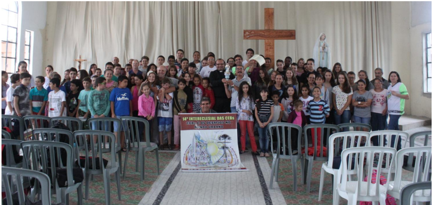
11 de março - Acolhida dos ícones na Igreja Matriz da Paróquia Nossa Senhora de Fátima - SJP.

Entre os dias 23 a 27 de janeiro de 2018 acontecerá em Londrina - PR, o 14º Intereclesial das Comunidades Eclesial de Base (CEBs). Os Intereclesiais são encontros que reúnem representantes das CEBs de todo o Brasil visam partilhar experiências e reflexões a respeito das CEBs. O tema será: CEBs e os desafios no mundo urbano e o lema: Eu vi e ouvi os clamores do meu povo e descí para libertá-lo. Ex. 3.7.