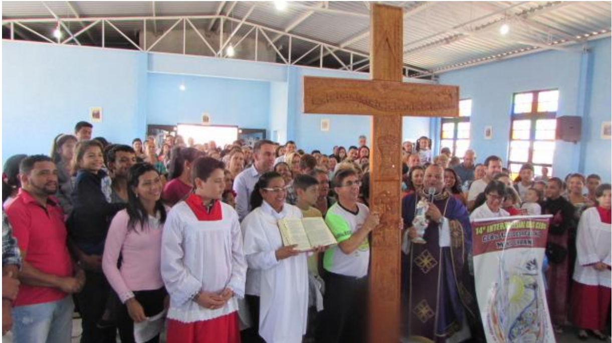
12 de março - Comunidade Nossa Senhora do Rocio da Paróquia Nossa Senhora de Fátima - SJP.