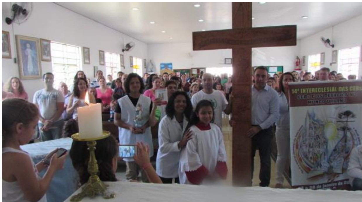
12 de março - Comunidade Santa Edwiges da Paróquia Nossa Senhora de Fátima - SJP.