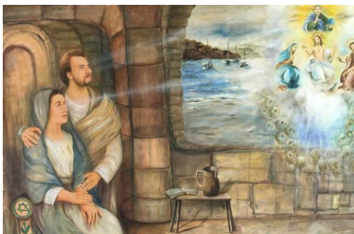
Seminário Santo Agostinho - Maringá.

Celebramos com grande alegria no dia 19 de março a solenidade de São José, esposo de Maria, ao qual Deus "confiou a custódia dos seus tesouros mais preciosos".