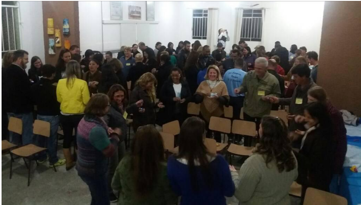
Momento de dinâmica - Coordenadores de catequese e catequistas de adultos

26 de junho a 02 de julho de 2017 – Ano 2017 – n.º 157 www.diocesesjp.org.br / aed@diocesesjp.org.br