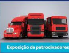
Exposição de patrocinadores