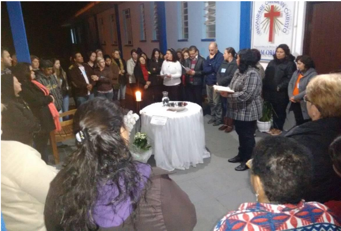
Momento Orante - coordenadores de catequese e catequistas de adultos.

26 de junho a 02 de julho de 2017 – Ano 2017 – n.º 157 www.diocesesp.org.br / aed@diocesesp.org.br