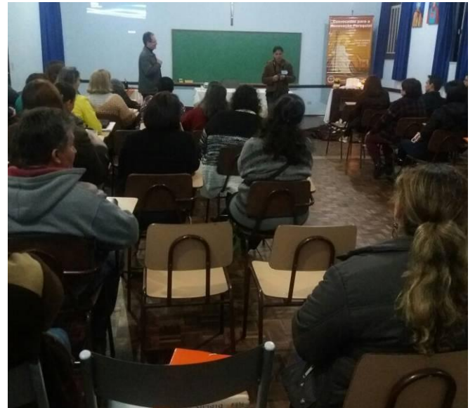
Coordenadores de catequese.