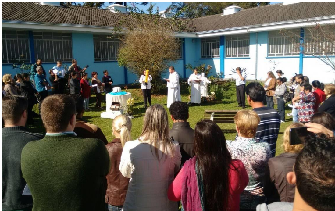
Entrega do Símbolo - coordenadores de catequese e catequistas de adultos.