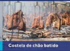
Costela de chão batido