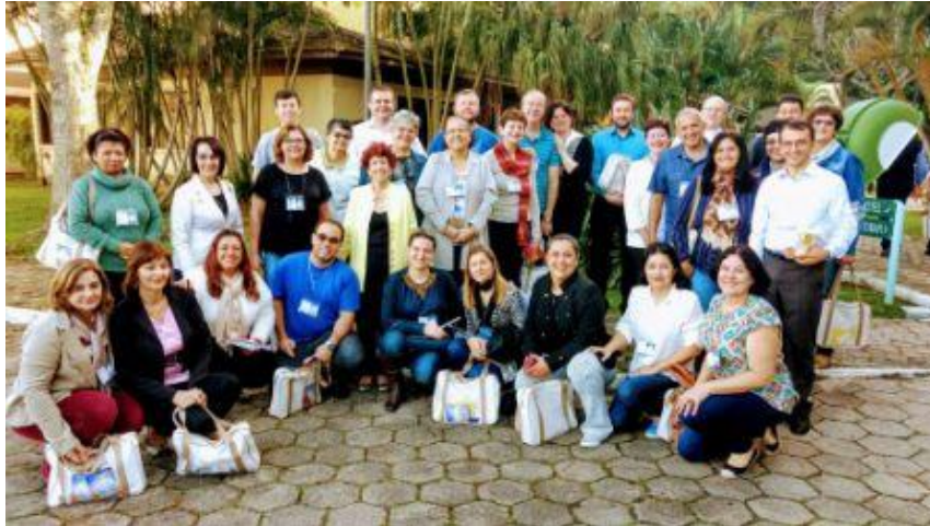
Representantes das diocese do Paraná - regional Sul II

Dos dias 16 a 18 de junho foi realizada na ilha de Florianópolis a nona edição do Sulão Bíblico-Catequético. O Sulão Bíblico-Catequético é um evento que acontece numa periodicidade aproximada de quatro anos, e seus participantes são catequistas e assessores para a animação Bíblico-Catequética das Dioceses dos Regionais da CNBB dos Estados de São Paulo (Regional Sul 1), Mato Grosso do Sul (Regional Oeste 1), Paraná (Regional Sul 2), Santa Catarina (Regional Sul 4) e Rio Grande do Sul (Regional Sul 3).