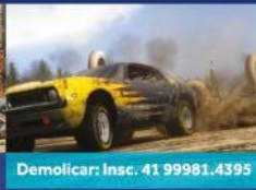
Demolicar: Insc. 41 99981.4395