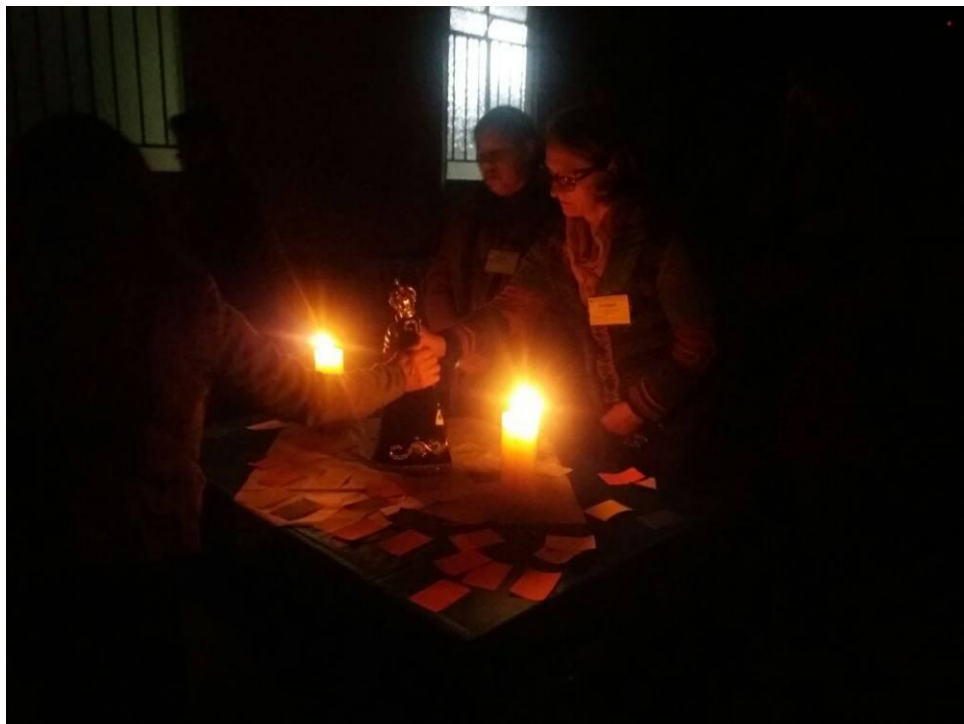
Momento orante - Coordenadores de catequese e catequistas de adultos