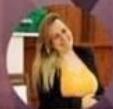
ALINE-COORD M.J. PR