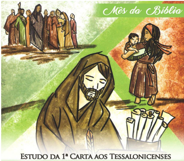
ESTUDO DA 1ª CARTA AOS TESSALONICENSES

“Anunciar o Evangelho e doar a própria vida! (cf. 1Ts 2,8).