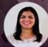
DANIELE-COORD M.J. BR

Capela São Sebastião - R. Antônio Greboge, 6100 Col. Malhada, São José dos Pinhais - PR