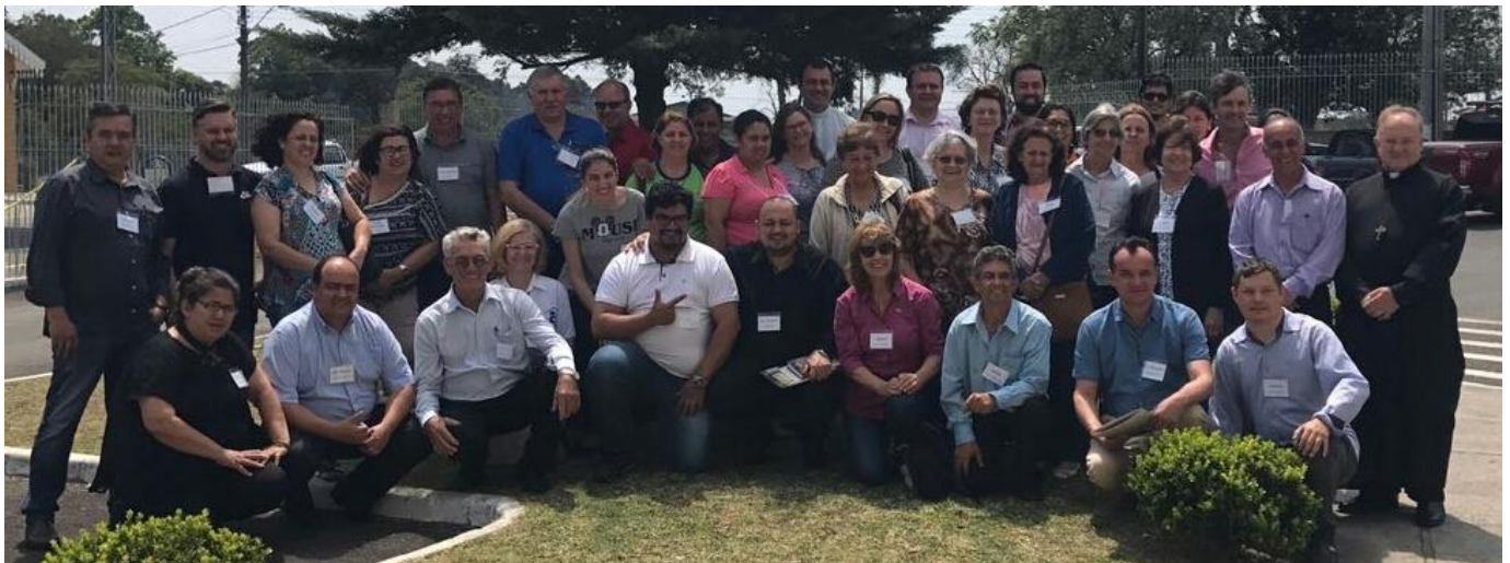
REPRESENTANTES DA DIOCESE DE SÃO JOSÉ DOS PINHAIS