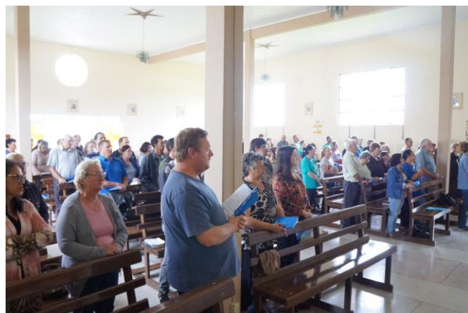
SETOR PASTORAL I

PARA 2018 ENCONTRO DIOCESANO PARA EQUIPES PAROQUIAIS DA PASTORAL DO BATISMO 22 de abril - 8h às 16h - Local a definir 02 de setembro - 8h às 16h - Local a definir