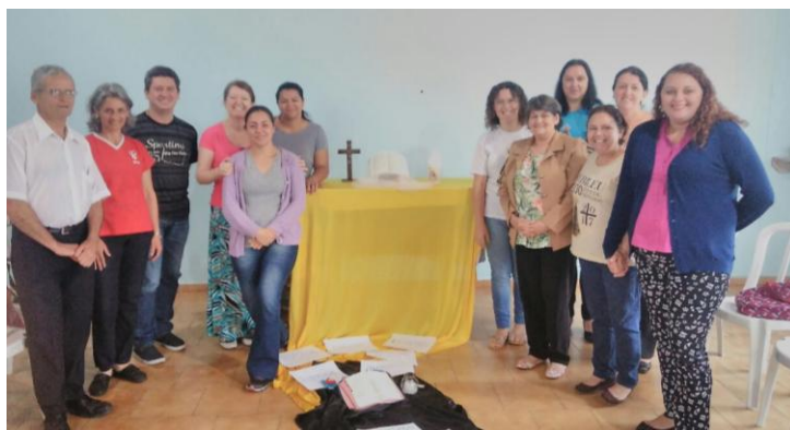
18 de novembro - Reunião Setorial Catequese Subsetor III - Par. N. Sra. do Perpétuo Socorro - Piraquara