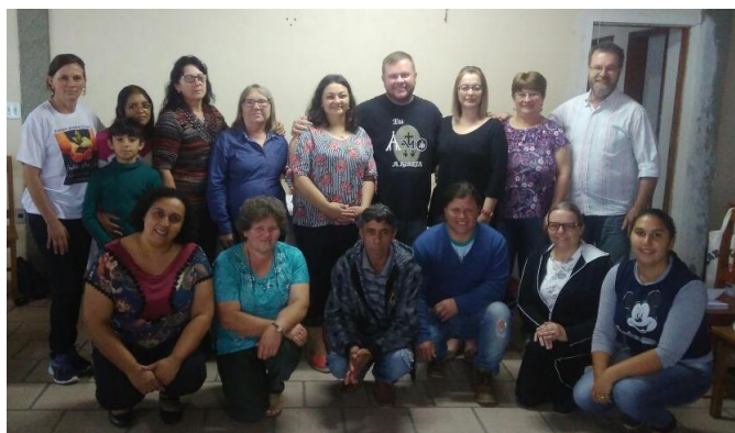
18 de novembro - Catequese Setor Pastoral I - Par. Santo Antonio - Lapa