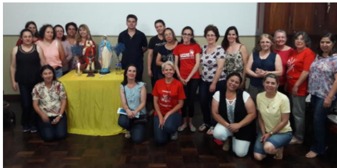
16 de novembro 19h30min às 21h30min - Catequese Setor III - Sede das Associações Católicas - Catedral