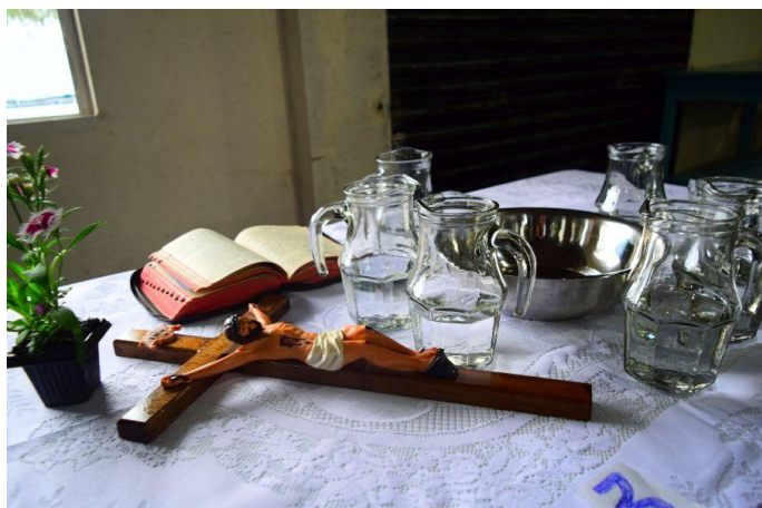
SETOR PASTORAL III