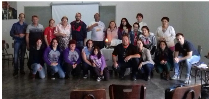
18 de novembro - Catequese Setor Pastoral II - Par. Nossa Senhora da Conceição - Agudos do Sul