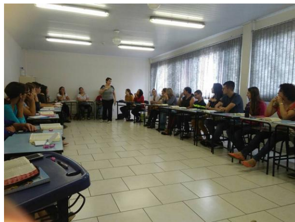
Os formadores de catequistas da Paróquia Nossa Senhora do Perpétuo Socorro de Araucária.