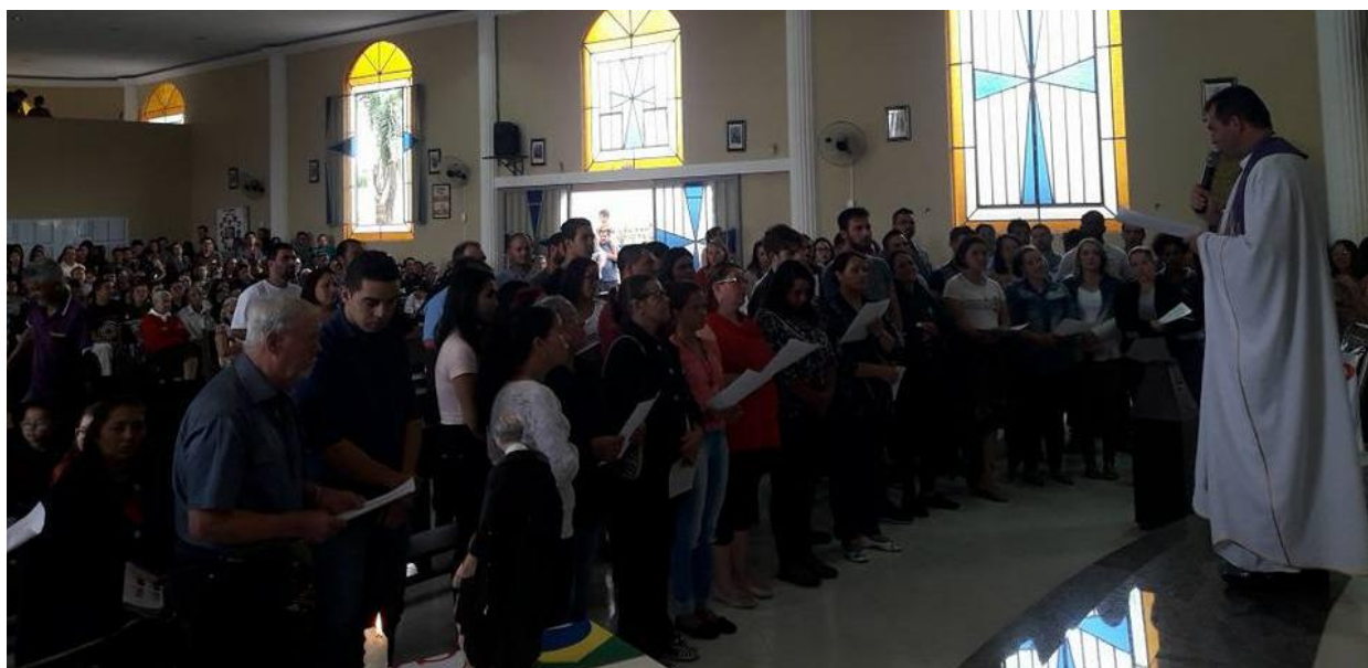
Rito da eleição na Comunidade São José da Paróquia Senhor Bom Jesus em Araucária

www.diocesespj.org.br / aed@diocesespj.org.br