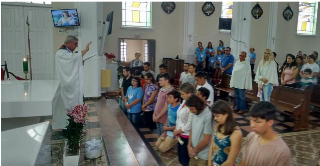
Entrega do Símbolo (Creio) e Oração do Senhor (Pai-Nosso) no Santuário Nossa Senhora dos Remédios.

Em 2017 a Equipe Diocesana da Catequese iniciou a Escola Bíblico-Catequética para catequistas da catequese com adultos. Um dos principais objetivos da escola é de o processo catecumenal seja vivenciado na catequese com adultos, ou seja, a partir da proposta do RICA seja construído o Itinerário catequético da catequese com adultos. A escola aconteceu em três finais de semana. Agora em 2018 alguns participantes da escola já estão vivenciando a prática do catecumenato.